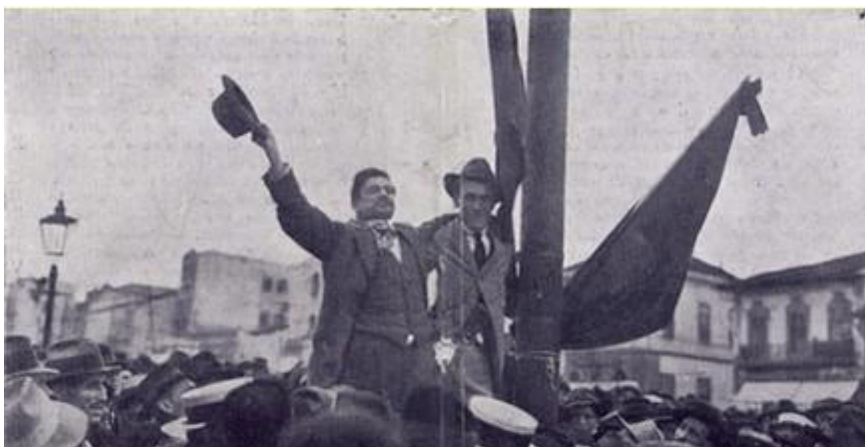
Figura 7 – Grevistas discursam na Sé

O Comitê de Defesa Proletária decidiu por aceitar a proposta dos industriais e do governo, optou por realizar no dia seguinte três comícios para comunicar os demais operários e operárias. Reuniram-se milhares 224 de trabalhadores e trabalhadoras, que votaram pelo fim da greve, com a disposição de voltar a ela caso os patrões e o governo não cumprissem com sua palavra. Nos teatros da Lapa e do Ipiranga também aconteceu votação, que se encerrou com a massa cantando a Internacional 225 .