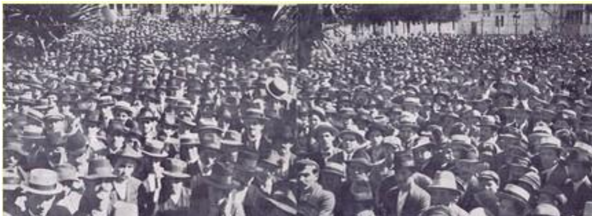
Figura 8 – Grevistas na Praça da Concórdia ouvindo a liderança do CDP discursar sobre a vitória