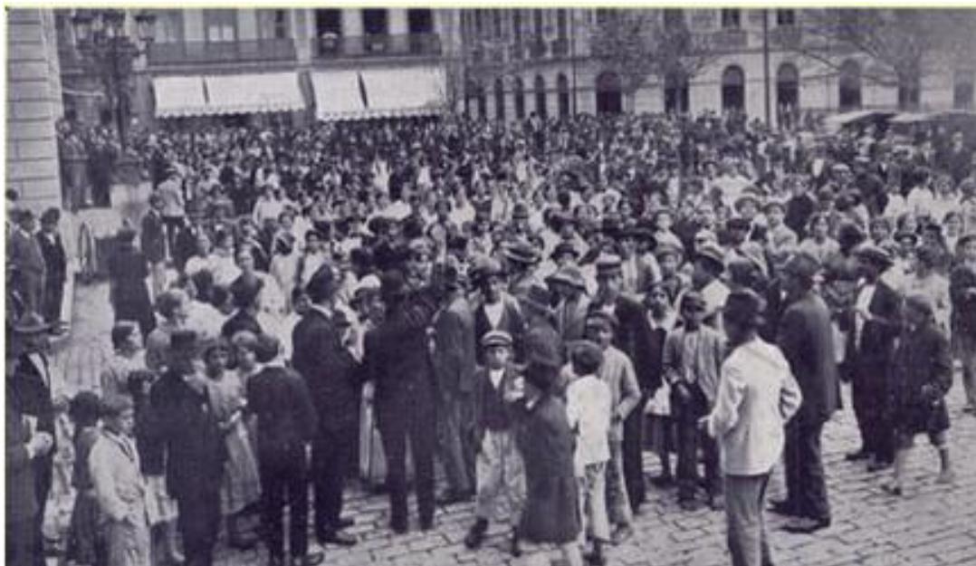
Figura 6 – Grevistas, a maioria mulheres operárias de várias fabricas da capital paulistana, em direção ao largo do Palácio do Governo para reunião com o Secretário da Justiça e Segurança Pública