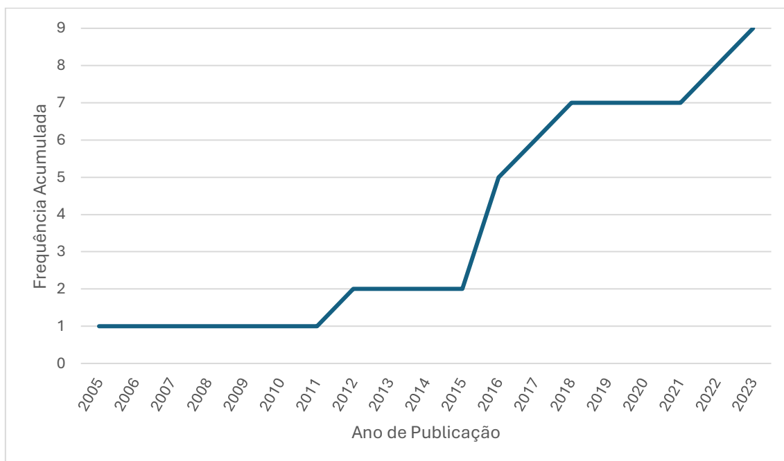
Figura 1: Frequência acumulada do número de artigos encontrados por ano de publicação

Em relação ao tipo de pesquisa foram encontradas seis pesquisas empíricas, uma documental e duas revisões de literatura, conforme podemos ver na Figura 2.