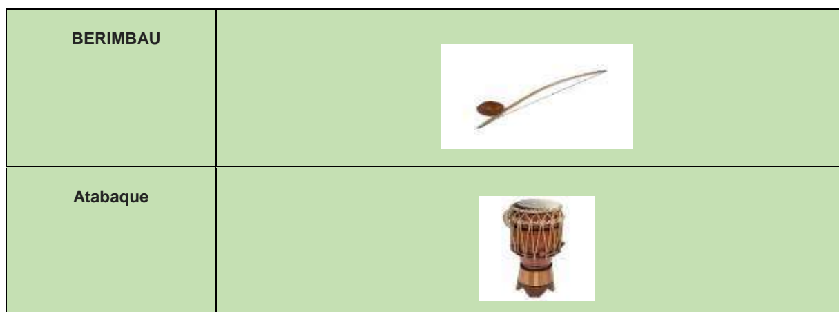
Quadro 6: Alguns Instrumentos Utilizados na pratica da Capoeira

Mas o interessante, é que tudo começa com a Ginga , o coração, que dá o ritmo da capoeira.