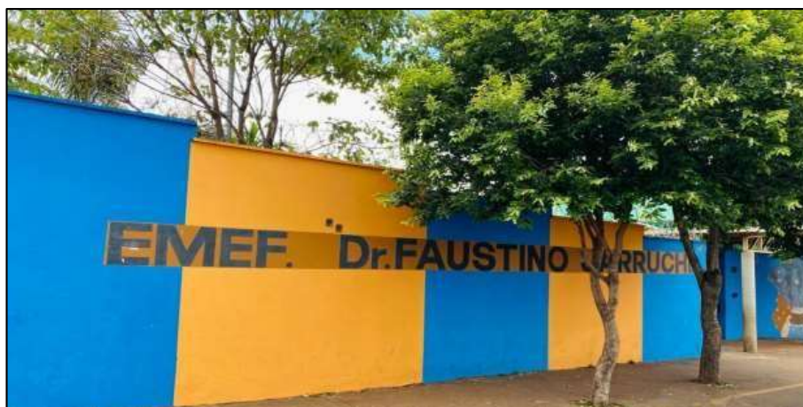
Figura 1: Escola EMEF Dr. Faustino Jarruche

A escola tem dezesseis salas de aula, oito no andar térreo e oito no superior, duas salas para depósito de material pedagógico, biblioteca, elevador para pessoas com necessidades especiais, sanitários nos dois pavimentos, refeitório, sala de informática, vídeo, almoxarifado e vestiários. Duas quadras, sendo uma coberta e outra descoberta, estacionamento para funcionários e visitantes Cozinha.