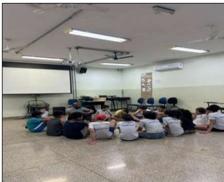
Figura 15: A importância da roda II