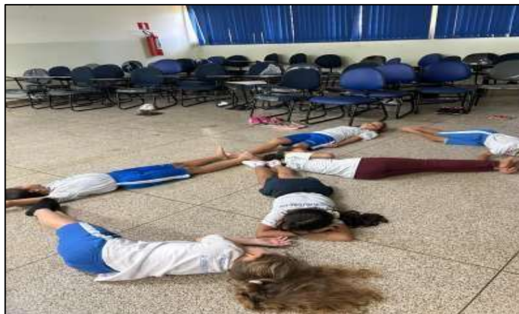
Figura 11: Formando letras III