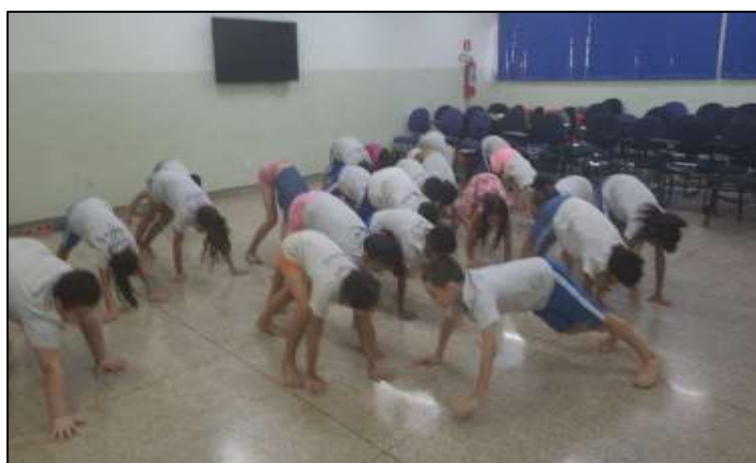
Figura 13: Movimentos II