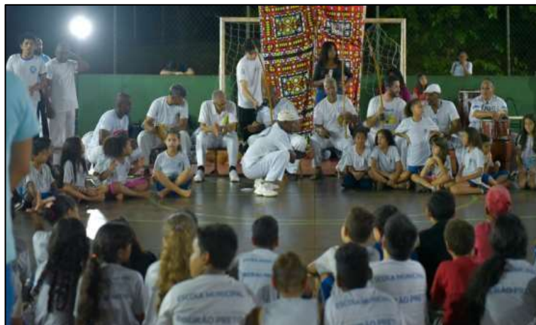
Figura 18: Finalização do ciclo