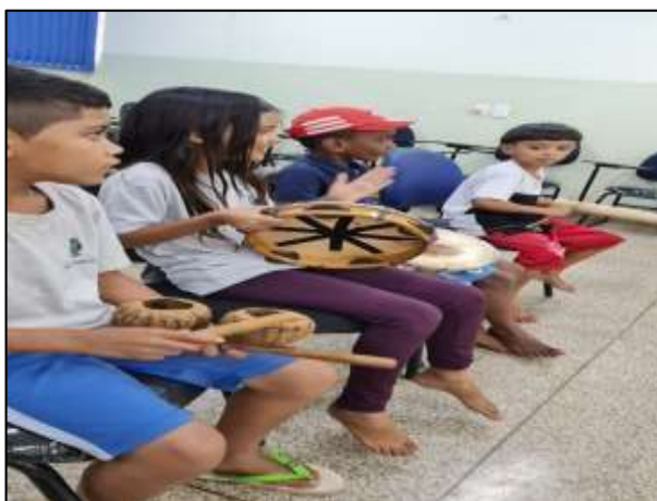
Figura 7: Musicalidade

No projeto a capoeira pode expressar-se em todos os seus elementos, durante os anos observados.