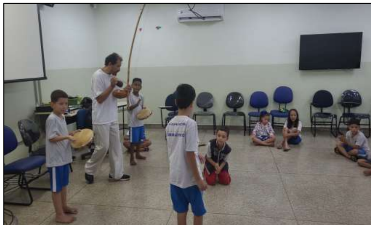
Figura 8: Musicalidade II