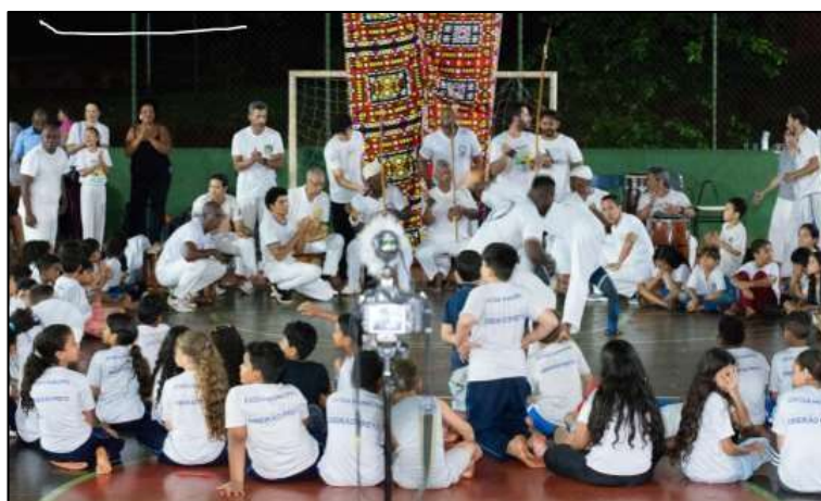
Figura 19: Finalização do ciclo II