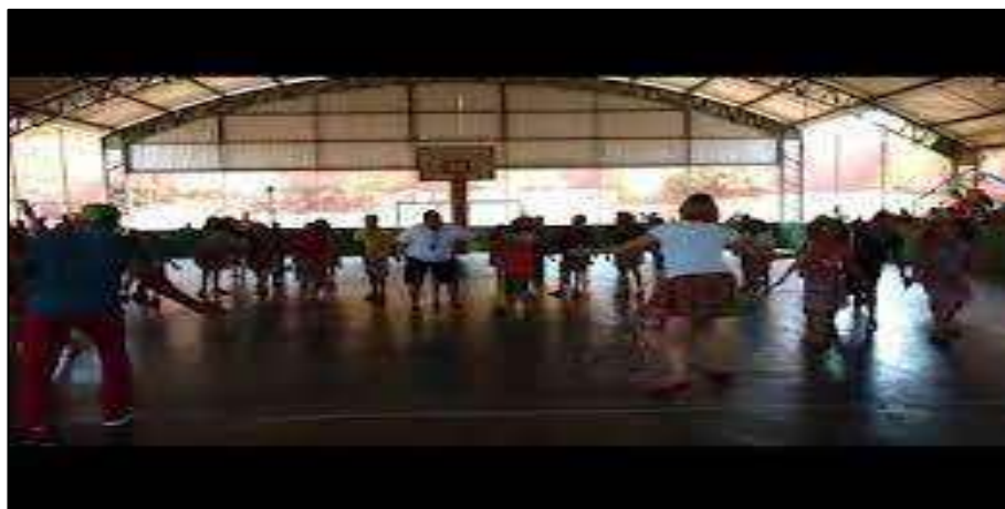
Figura 6: Quadra coberta