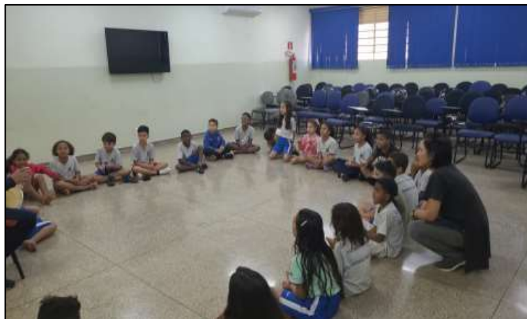
Figura 14: A importância da roda