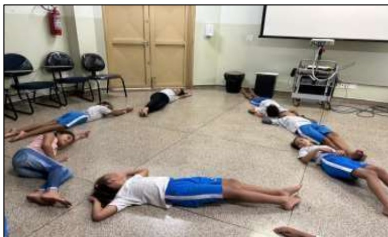
Figura 10: Formando letras II