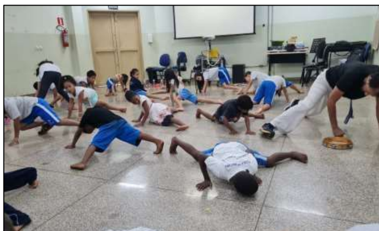
Figura 12: Movimentos