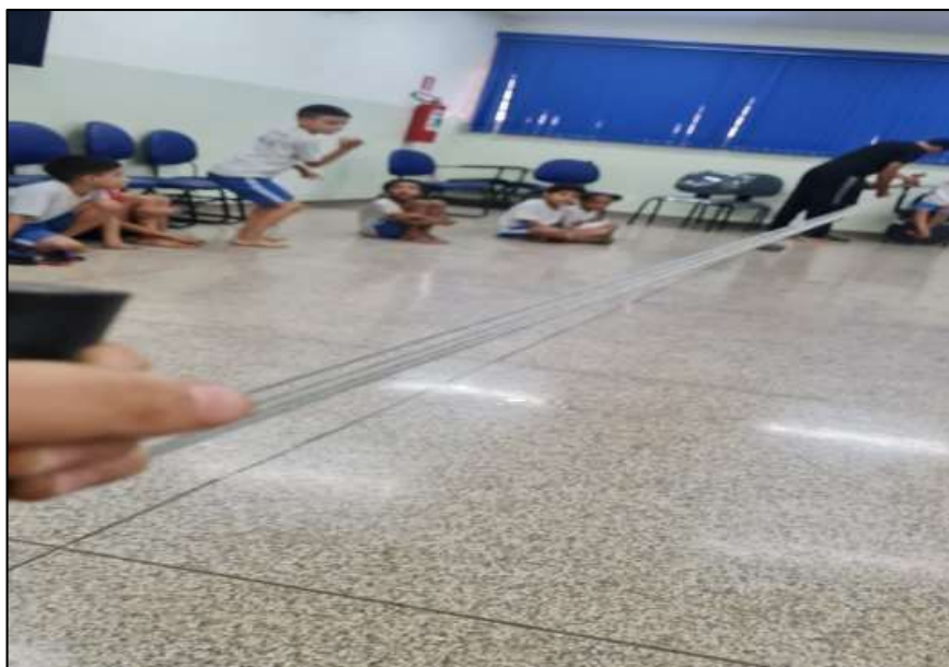
Figura 17: A construção do cordão