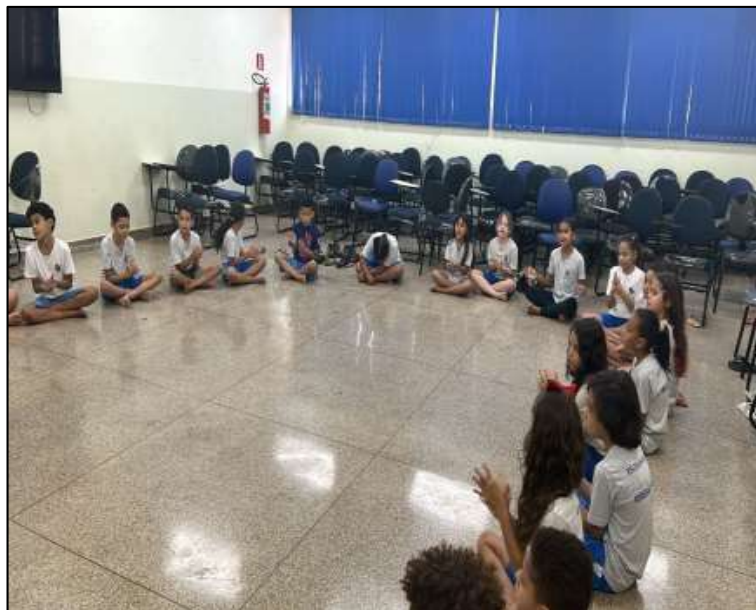
Figura 16: A importância da roda III