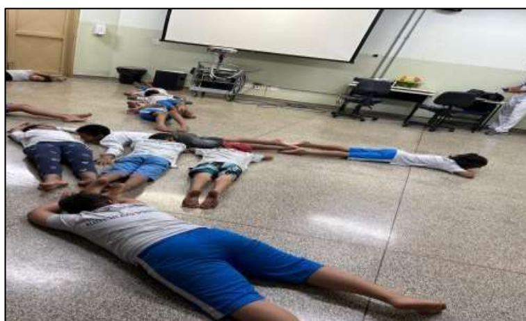
Figura 9: Formando letras