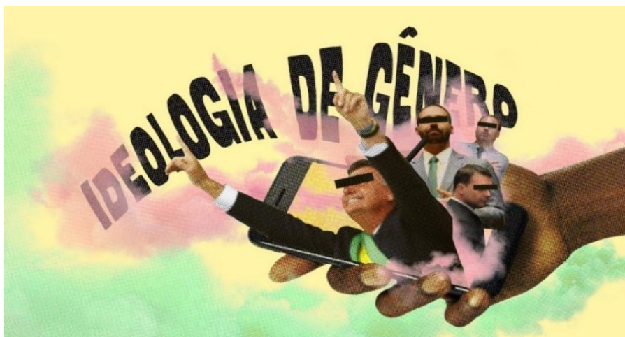
Figura 1. Ideologia de Gênero.

A campanha contou com o apoio estratégico de instituições religiosas, grupos empresariais e redes sociais, que desempenharam um papel fundamental na consolidação de um discurso de ódio. Através dessas alianças, reforçaram a narrativa de "Deus, Pátria e Família," um bordão amplamente utilizado pela extrema direita que carrega elementos fascistas e tem sido adotado como estratégia política não apenas no Brasil, mas em diversos países (Almeida, 2022).