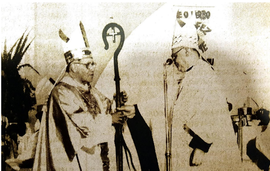
Imagem do momento em que Dom Paulo Evaristo Arns, OFM, então arcebispo de São Paulo, passa o báculo a Dom Fernando Legal, SDB, significando a criação da igreja particular de São Miguel Paulista e a tomada de posse do primeiro bispo diocesano. A expressão facial de Dom Paulo foi interpretada como demonstração de seu descontentamento com relação à divisão da Arquidiocese de São Paulo.