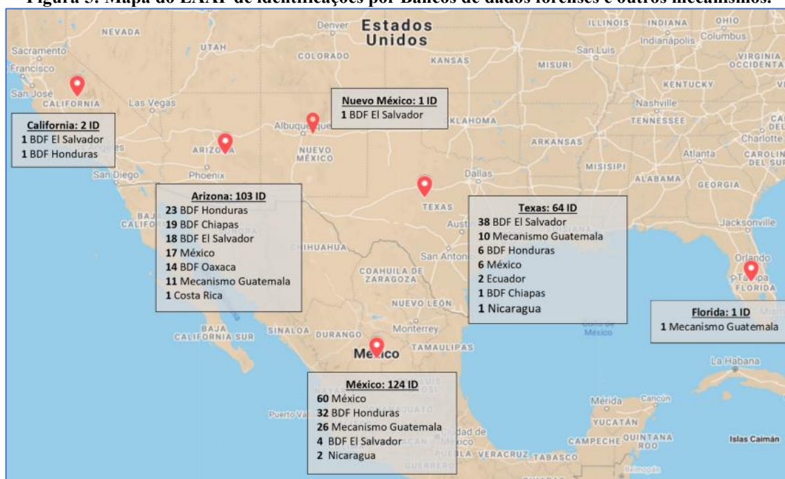
Figura 5: Mapa do EAAF de identificações por Bancos de dados forenses e outros mecanismos.