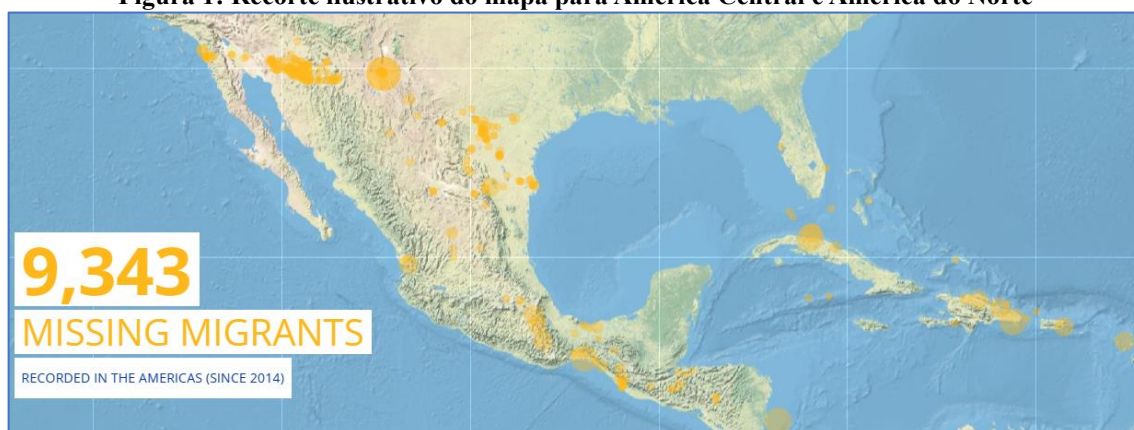
Figura 1: Recorte ilustrativo do mapa para América Central e América do Norte