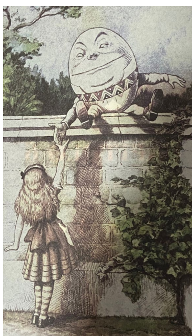
(John Tennel; Alice Através do Espelho, 2023)