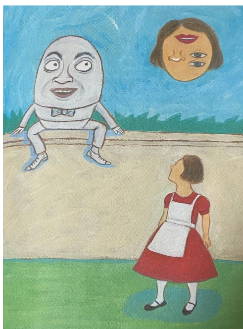
(Laurabeatriz; Alice através do espelho... e o que ela encontrou por lá, 2023)

A seguir, transcrevemos os trechos em que figuram as palavras-valise cujas traduções serão analisadas, tanto do original em inglês, de 1902, como das três edições brasileiras selecionadas (duas traduções e uma adaptação).