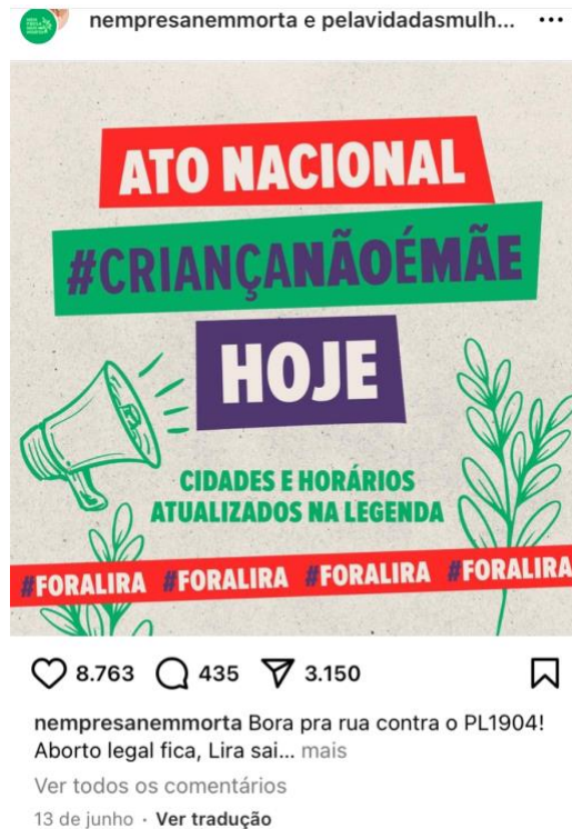
Figura 7: Imagem da postagem sobre o Ato Nacional #criancanaoémãe.