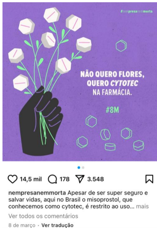
Figura 4: Imagem da postagem sobre o fármaco Cytotec .