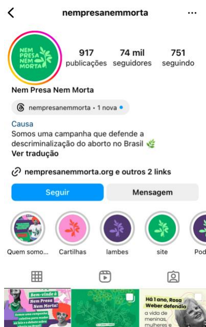
Figura 1: Imagem do perfil “Nem presa, nem morta” na rede social Instagram