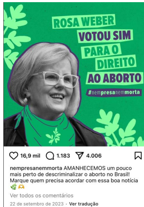
Figura 2: Imagem da postagem sobre o voto de Rosa Weber.