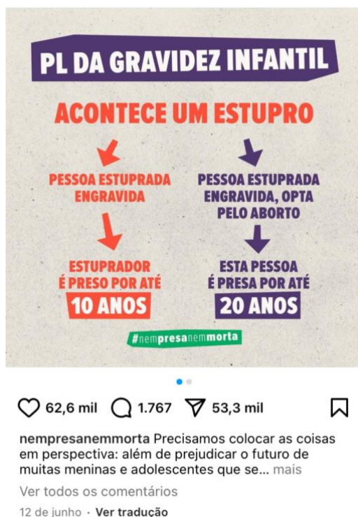
Figura 5: Imagem da postagem sobre a “PL da gravidez infantil”.