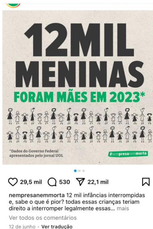
Figura 6: Imagem da postagem crianças que foram mães em 2023.