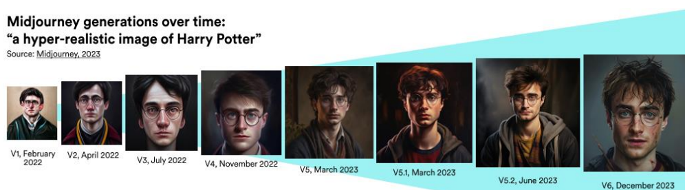
Figura 3 – Gerações do Midjourney ao decorrer do tempo: “Uma imagem hiper-realista do Harry Potter”

Deste modo, visto que essa tecnologia é capaz de aprender consigo mesma e se aprimorar constantemente, seu avanço nos últimos anos se deu de maneira extremamente rápida e notável, evoluindo de esboços crus até obras de altíssima qualidade.