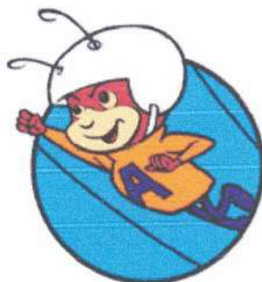
Foto 4. Formiga Atômica

A primeira sujeita participante de nossa pesquisa foi Formiguinha Atômica que nos acolheu prontamente no espaço do SASF Grajaú III. Após a leitura do Termo Livre de Consentimento, ela assinou, foi esclarecida quanto ao roteiro prévio perguntamos como ela gostaria de ser chamada na pesquisa e escolheu o nome de Formiguinha Atômica do qual relatou ter grande significado para ela, pois era assim que seu pai a chamava.