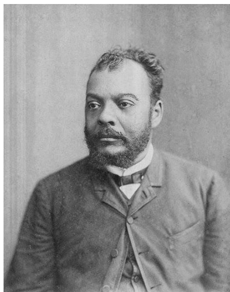
Imagem I: José do Patrocínio (1853-1905)

De volta à problemática em torno da palavra “inimigo”, fica como inconclusiva a razão pela qual Patrocínio decide usá-la. De qualquer modo, a minha escolha inicialmente derivou daquela feita por ele, em 1884. Posteriormente, ao ter em mãos as fontes que respaldam meus argumentos, me pareceu realmente adequado o uso de “inimigos”, pois nenhuma outra palavra justificaria aquilo que foi dito sobre José do Patrocínio. O caráter racial dos ataques contra ele fogem do campo das ideias, ainda que fossem respaldados por elas.