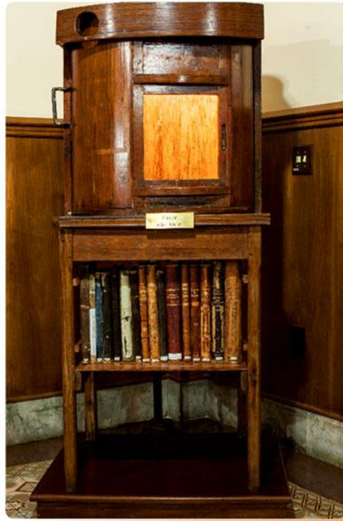
FIGURA 4: RODA DOS EXPOSTOS