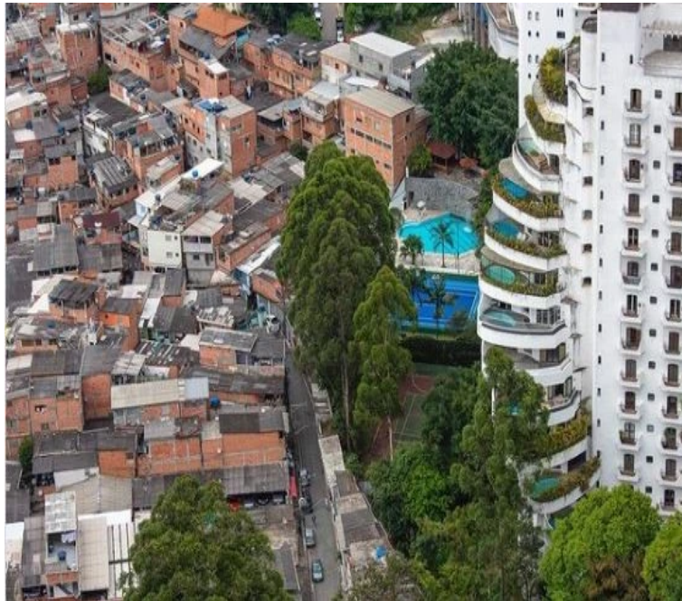
FIGURA 3: CONTRASTE URBANO 5

competências e ações no âmbito da prevenção e da atenção especializada no SUAS” (BRASIL, 2011, p. 15).