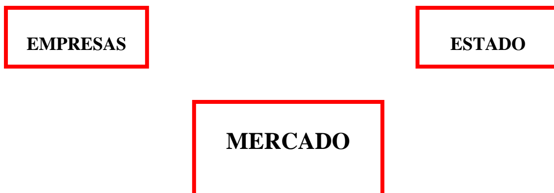
Figura 3. Novo capitalismo ( atual)

Therborn possibilita melhor visualização da questão com o esquema abaixo: