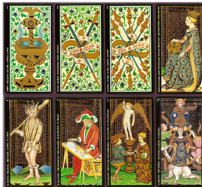
Figura 6: Tarô de Visconti-Sforza

Disponível em: < www.clubedotaro.com.br/site/h23_15_visc_sforza.asp >. Acesso em: 10 mar. 24.