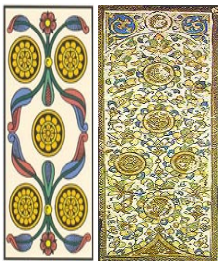
Figura 3: Cinco de ouros dos tarôs de Marselha e Mameluco

Disponível em: < http://www.clubedotaro.com.br/site/n45_4_ouros.asp > e < http://www.clubedotaro.com.br/site/h23_15_mamluk.asp >.