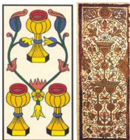
Figura 5: Três de copas dos tarôs de Marselha e Mameluco

Disponível em: < http://www.clubedotaro.com.br/site/n45_6_copas.asp > e < http://www.clubedotaro.com.br/site/h23_15_mamluk.asp >. Acesso em: 03 set. 23.