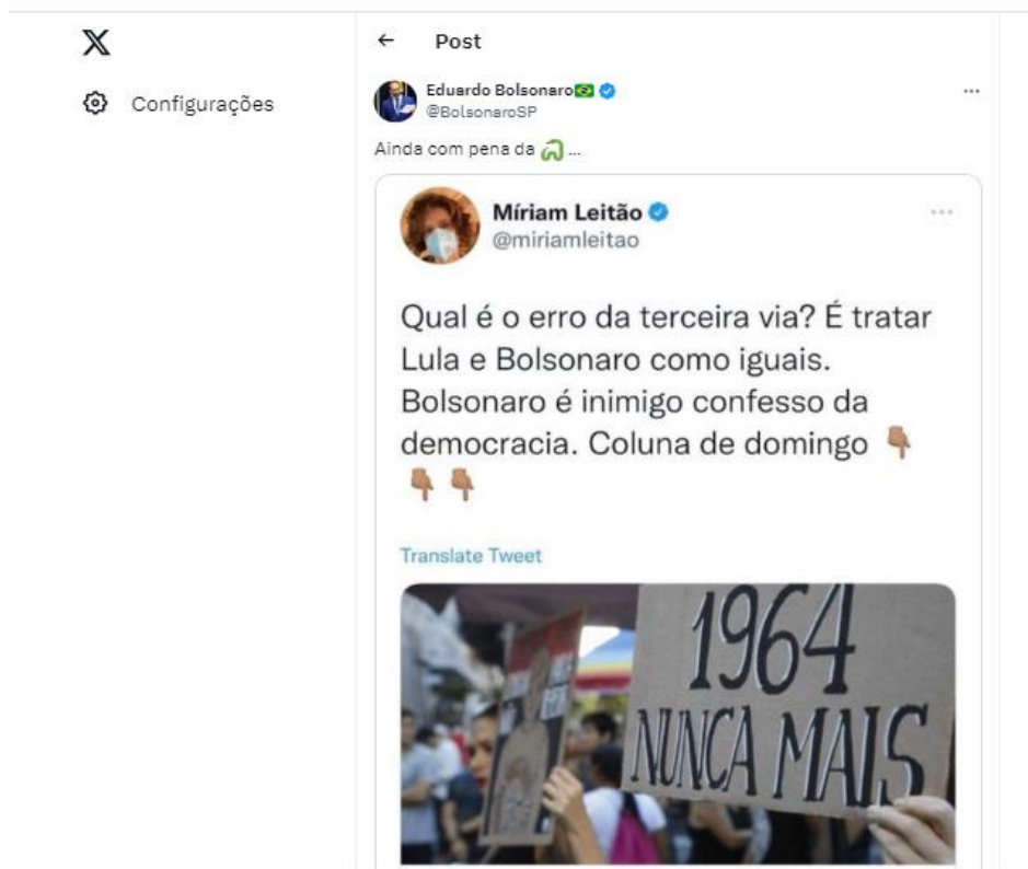
Figura 2 – Twitter de Bolsonaro sobre Miriam Leitão