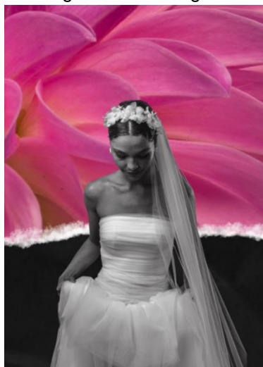
Figura 12- Montagem