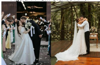
Figura 14- Um Grande Amor

E por fim a parte mais especial da revista, onde foi colocado uma coleção de fotografias de casais felizes no seu grande dia. Nessa parte o importante da revista é demonstrar como a empresa participa dessa união e todo o cuidado que temos com cada casal, e não apenas com as noivas.