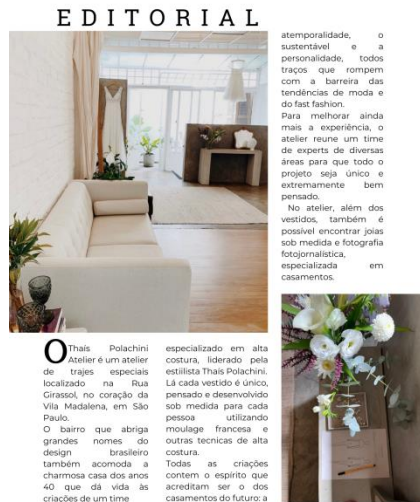
Revista Thaís Polachini Atelier- 2023

A tipografia escolhida para o título da página (figura x) foi a Roboto Slab, e as imagens utilizadas são fotos tiradas do atelier, assim se tornando uma página de apresentação do atelier, onde foi explicado o que é e quais os objetivos da empresa.