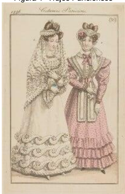
Le Journal des Dames et des Modes-1826