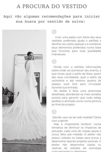
Figura 11- A Procura do Vestido