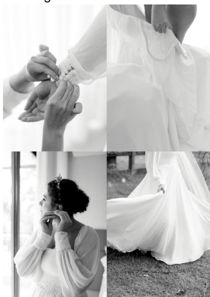
Figura 13- O Grande Dia