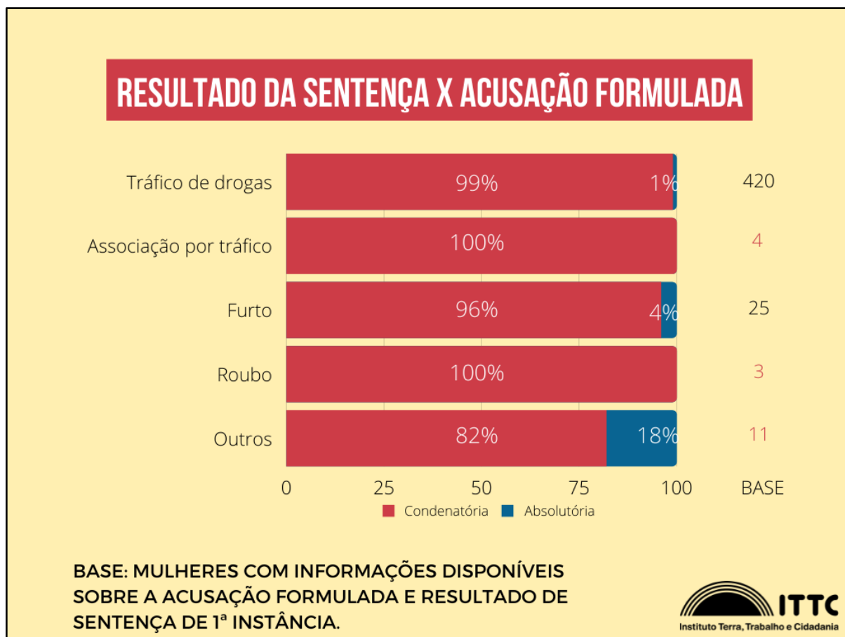
Gráfico 3 - Resultado da sentença x acusação formulada