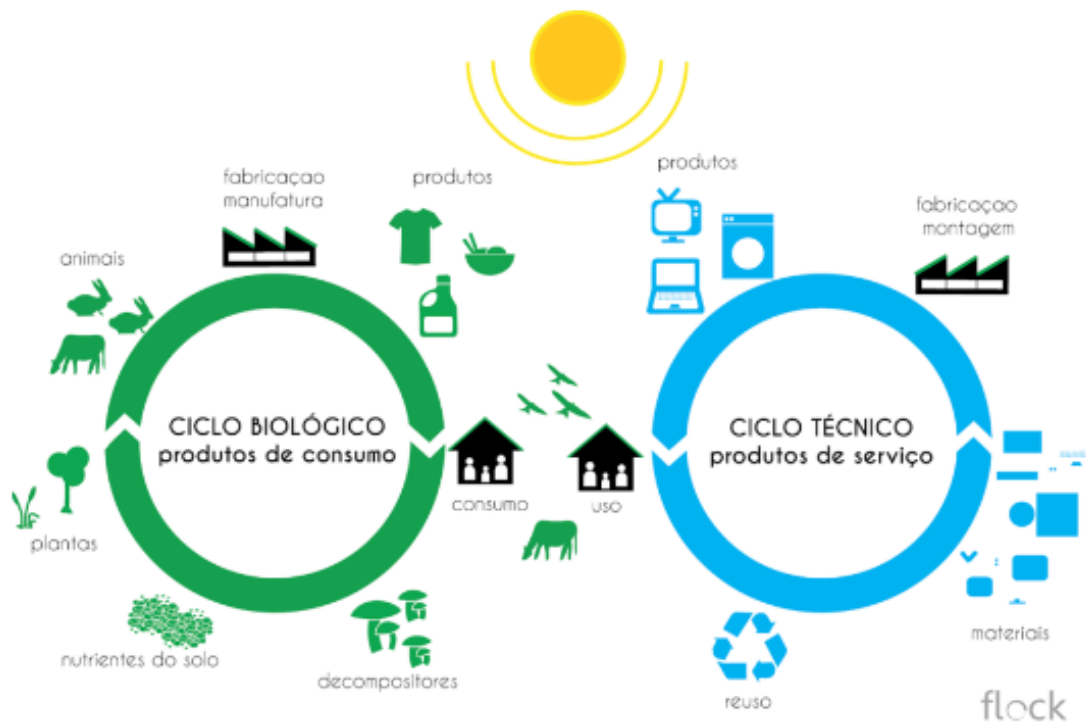
Figura 2 - Ciclo biológico e ciclo técnico