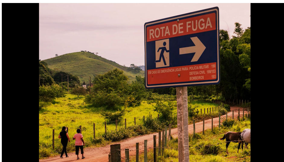
Figura 7 – Placa de Rota de Fuga em Barra Longa (MG)

(adicionada após o rompimento de Mariana, que atingiu a comunidade), enquanto a narração aborda a possibilidade de mudança que a memória traz.