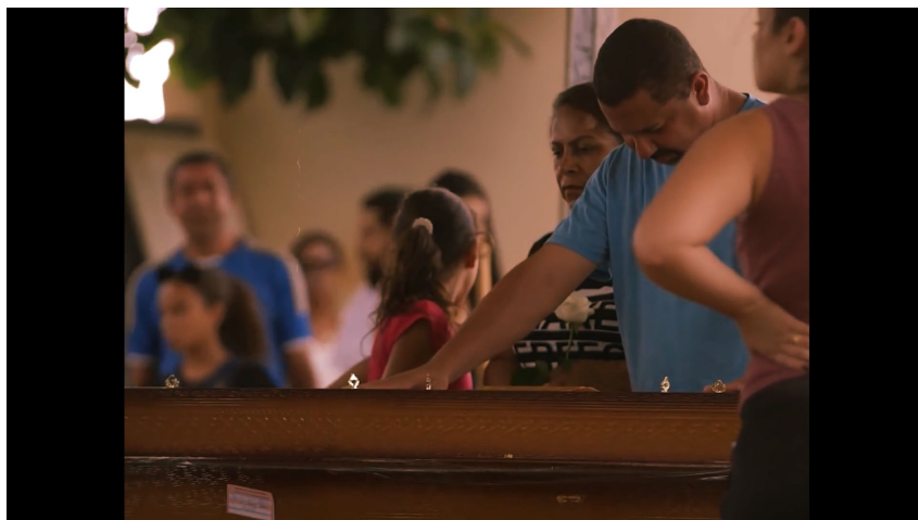
Figura 3 – Velório pós-desastre em Brumadinho