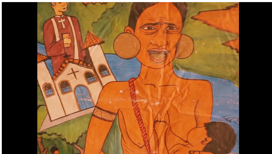
Figura 1 – Ilustração de mãe e filho Krenak em contexto de conflitos históricos

Durante a produção foram notáveis como os próprios arquivos contaminaram os caminhos da direção. Por mais que relacionar os conceitos sobre memória com os depoimentos e imagens fosse a ideia inicial, outras nuances dos próprios audiovisuais influenciaram a narrativa como um todo. Os Krenak e a memória relacionada ao Rio Doce são um bom exemplo, pois a partir de reportagens e vídeos encontrados durante a produção, questões históricas e culturais sobre os povos indígenas se revelaram e pude conectá-las não apenas com questões memoriais coletivas do local, mas também da memória e história do próprio Brasil.