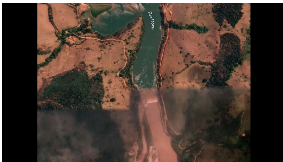
Figura 4 – Rio Doce antes e depois dos desastres

Aqui é introduzida a questão do Rio Doce. A narração apresenta como ele, grande afetado ambiental das tragédias, se tornou uma forma simbólica da memória desestabilizada ao passo em que está ferido, perdido e completamente alterado. Imagens do Rio Doce no Google Earth são utilizadas na comparação entre o rio de antes e de agora.