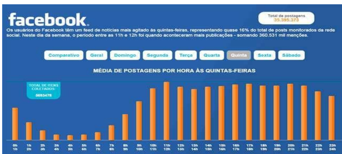
Figura 2 - Estudo Scup: O melhor dia do Facebook é quinta-feira.

Na figura abaixo a média de postagens por hora nas quintas-feiras.