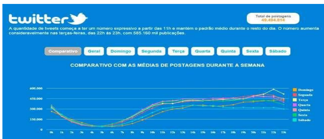
Figura 3 - Estudo Scup: Terça-feira, às 23 horas é o pico do Twitter.

Na figura abaixo os horários com mais postagens.