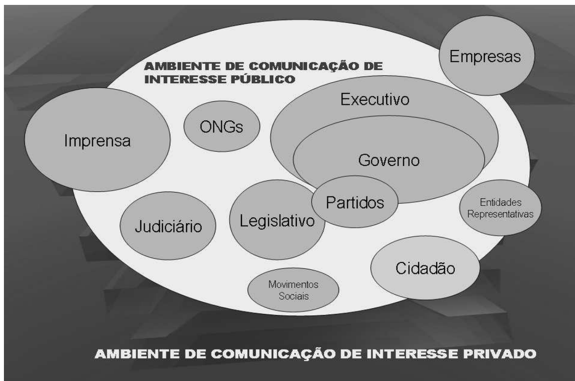
FIGURA 1 – Modelo campo da comunicação pública

É nesta lógica que Duarte apresenta o seguinte modelo de comunicação pública: