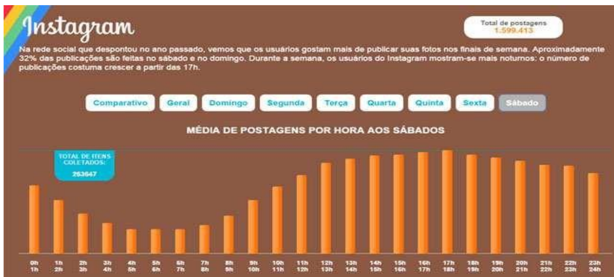
Figura 4 - Estudo Scup : usuários noturnos e o pico acontece aos sábados.

Na figura abaixo a os horários com mais postagens.