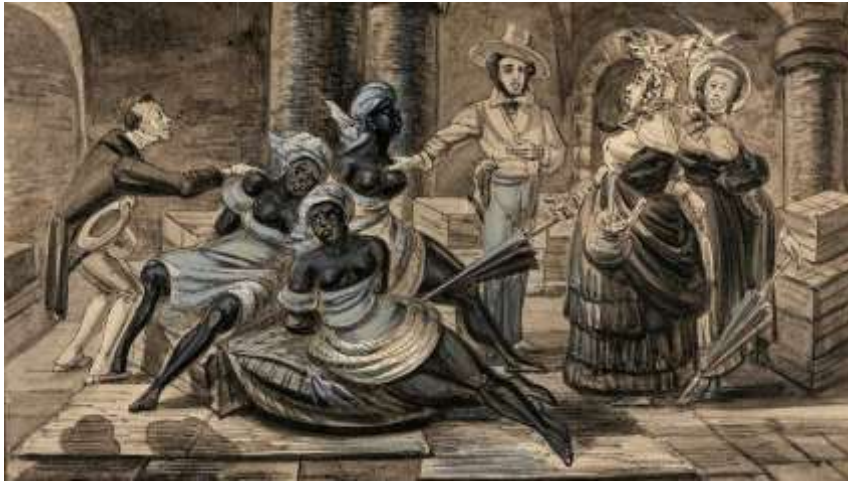
Figura 2 - subjugação e violência dos corpos escravizados