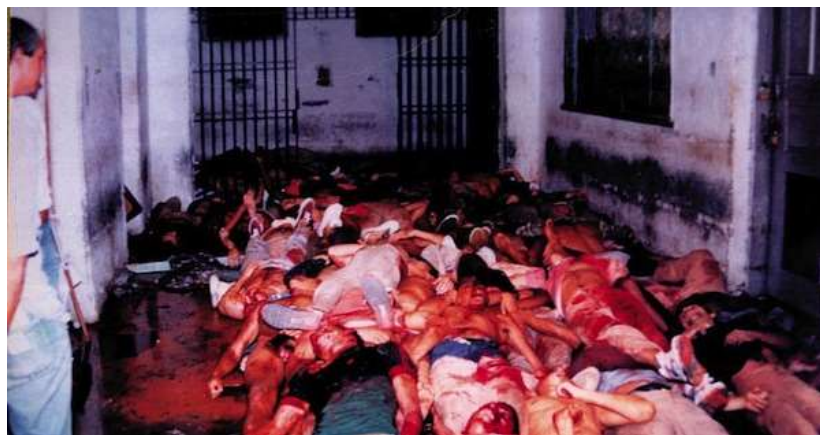
Figura 4 - Massacre do Carandiru