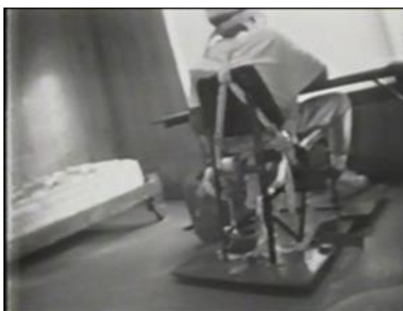
Figura 2 - Criança de braços em uma placa de retenção de quatro pontos conectada a um dispositivo de choque elétrico.