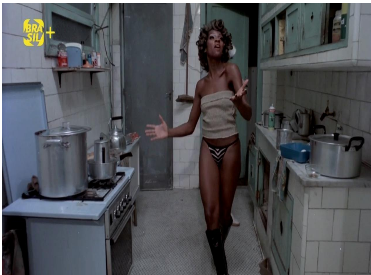
Figura 4 – Cena do filme Tudo bem (1978)