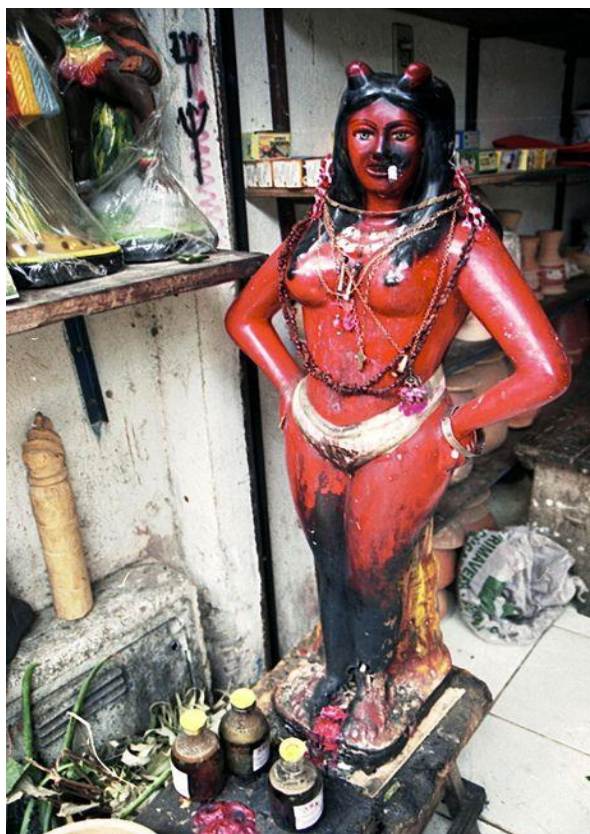
Figura 2 – Imagem religiosa da Pombagira