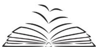
Academia Estudantil de Letras