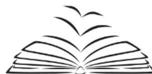
Academia Estudantil de Letras Biblioteca João Cabral de Melo Neto