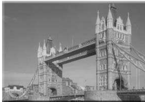
Figura 2: Ponte de Londres 1890

Em 1176, estava em construção a Ponte de Londres 3 (vide Figura 2), e, a Abadia de Westminster seria iniciada em 1221. Essas circunstâncias podem ter estimulado a fundação da Corporação dos Pedreiros de Londres com o nome de “Santa Arte e Associação dos Pedreiros”, em 1220. Esse período foi caracterizado com uma grande atividade construtora. Talvez seja útil lembrar, na seqüência do que se está desenvolvendo, que por volta de 1364 foram organizadas as Companhias de Libré ( Libery companies ); os operários foram obrigados a aderir à Companhia do ofício a que pertenciam, assim, a Companhia dos Maçons ( Company of Masons ) era uma das noventa e uma Companhias de Libré de Londres.