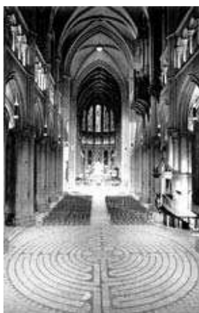
Figura 1: Catedral de Chartres

Talvez, o primeiro questionamento que deva ser feito, neste momento, refira-se à obliquidade engendrada entre a Maçonaria e a Igreja Católica. Nesse binômio de conjecturas, a Igreja ergueu, naquele momento histórico, monumentos colossais como, por exemplo, a Catedral de Chartres (vide figura 1), na França, em estilo gótico, com 167 vitrais, que levou 100 anos para ser concluída, em 1260; isso, certamente, demonstra a riqueza e o poder do clero. As grandes catedrais construídas, a partir do século XI, vieram de uma crença que situava a presença de Deus nos edifícios. (NOBRE, 2007).