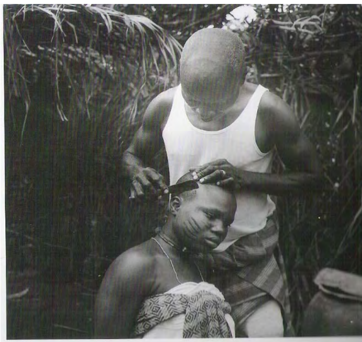
Fig 2 : Ritual de raspagem no Benin.

Nos cultos de nação, candomblés e religiões brasileiras com influências africanas, práticas como o sacrifício de animais e o uso do sangue são freqüentes nos rituais. Outros mais específicos implicam na mudança de hábitos alimentares e modificações corporais do iniciado.