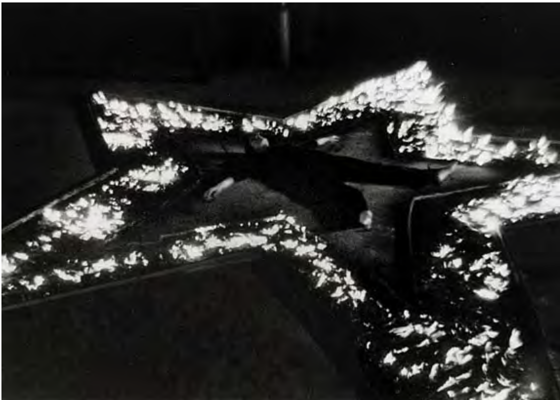
Rhythm 5, 1974

Um ritual de limpeza física e espiritual foi criado na performance Rhythm 5 . Uma enorme estrela de cinco pontas feita de madeira é incendiada no chão da sala. A artista atira ao fogo partes de seus cabelos e unhas e depois se deita no centro da estrela de fogo. Inconsciente pela falta de oxigênio, ela é , mais uma vez, retirada por pessoas da platéia que perceberam que parte da perna de estava queimando sem que ela reagisse.