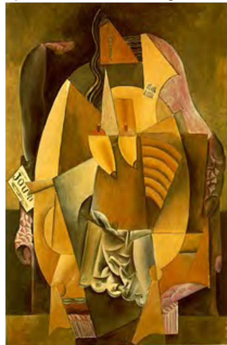
Pablo Picasso, Femme en chaise assise dans un fauteil, 1913

O cubismo fragmenta a estampa bidimensional anteriormente estilizada pelos pós-impressionistas. Assim como eles, os dadaístas, surrealistas e outros tantos vanguardistas, atentos ao caráter finito e transitório dos elementos na modernidade, despedaçam e deformam a figura humana: