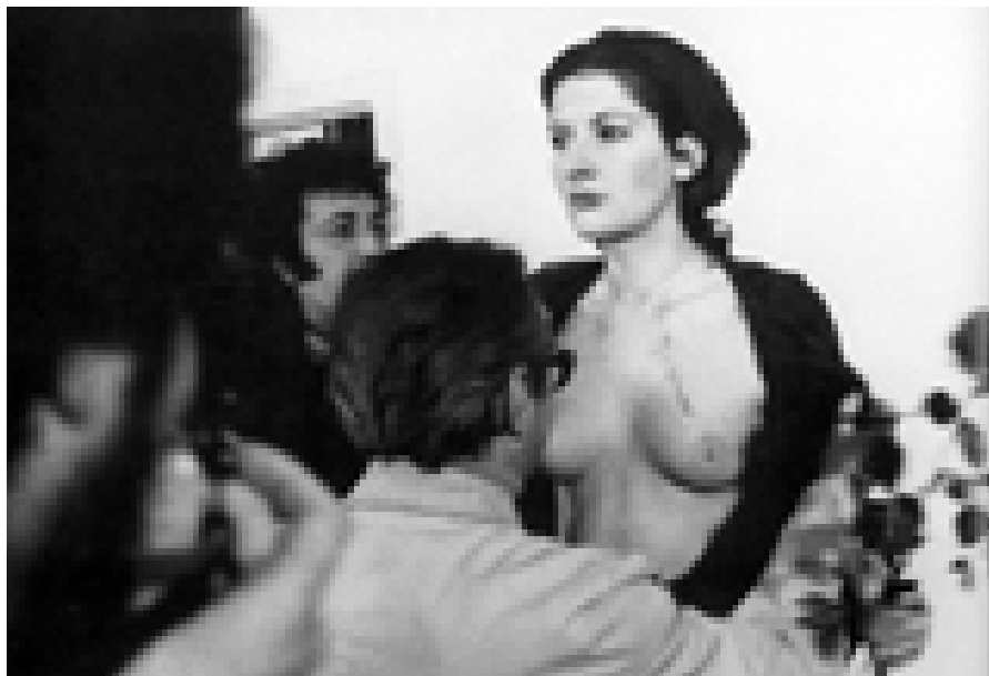
Rhythm 0, 1974

própria biografia, que buscam conhecer seus limites mentais e físicos ao mesmo tempo em que carregam um certo propósito de criticar a artificialidade das representações e dos simulacros. Ou seja, propostas que promovem um encontro com o outro mediado por ficções.