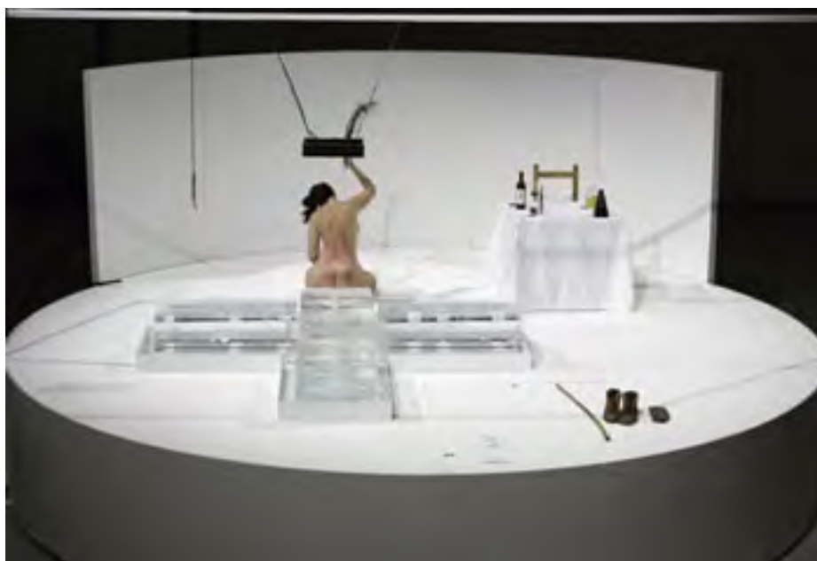
Thomas's Lips, 2005

Thomas's Lips foi realizada pela primeira vez em 1975 e re-apresentada no Guggenheim de Nova Iorque em 2005 durante um projeto ironicamente batizado de "Seven Easy Pieces" no qual Marina apresentou sete performances diferentes ao longo de sete dias. Começa com a artista comendo lentamente cerca de um kilo de mel e bebendo um litro de vinho tinto. Quebra