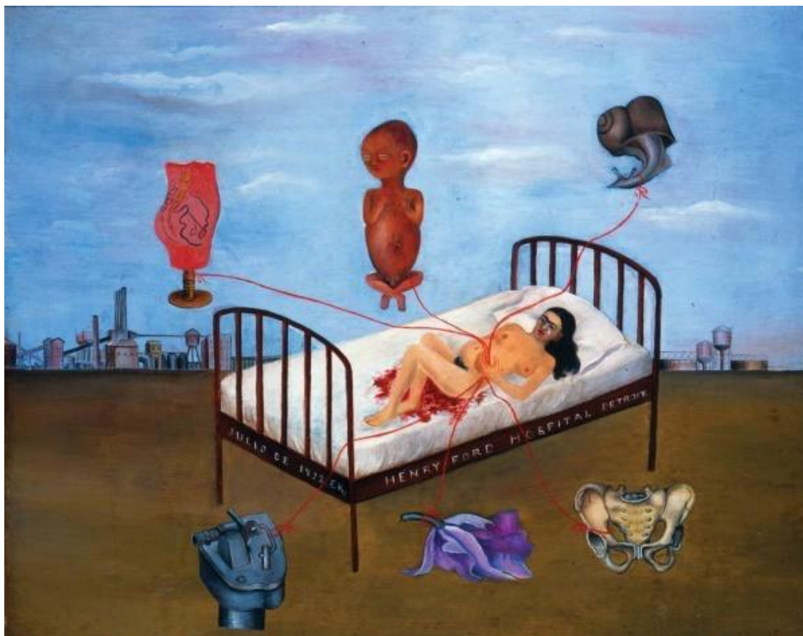
Figura 2 - Obra "Hospital Henry Ford" - Frida Kahlo, 1932.