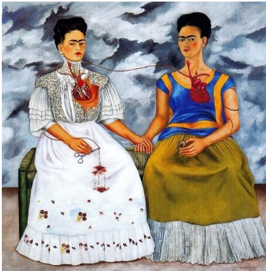
Figura 3 - Obra " Duas Fridas " - Frida Kahlo, 1939.