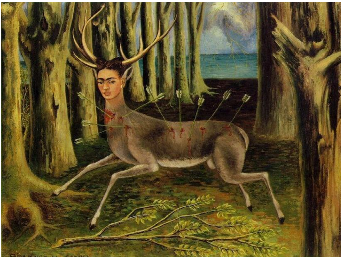
Figura 4 - Obra "O veado ferido" - Frida Kahlo, 1946.