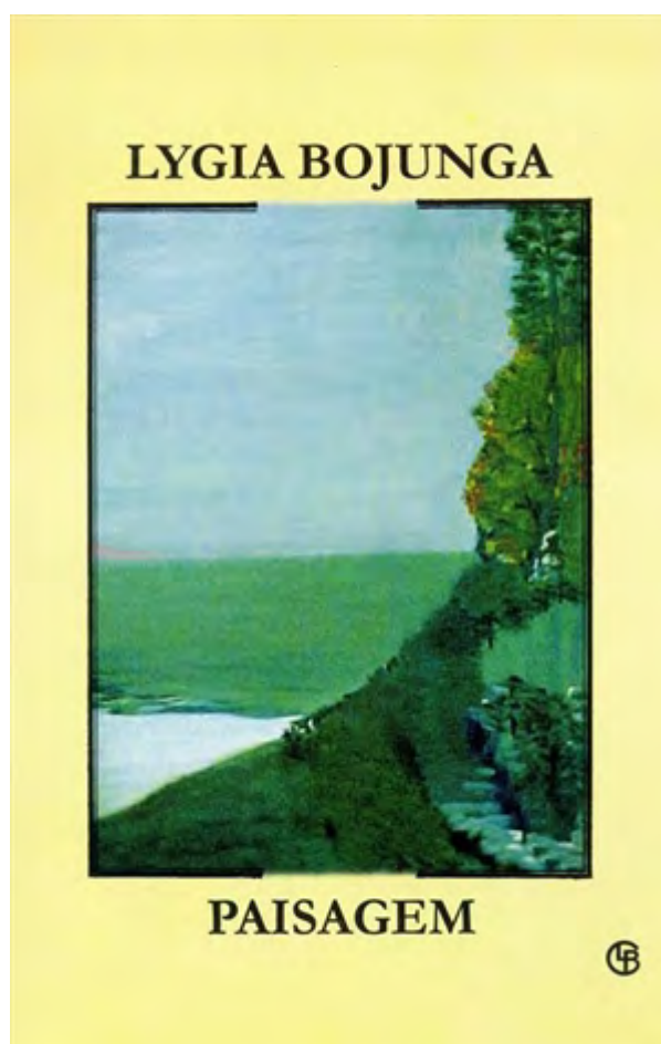
Ilustração 2: Isaac Liberato-Óleo sobre tela (1956).

O óleo em tela é do carioca Isaac Liberato e foi produzido em 1956. É uma Paisagem, provavelmente do Rio de Janeiro, também cenário do texto. Esta obra pertence ao acervo do Museu de Imagens do Inconsciente situada no Hospital de Engenho de Dentro, Rio de Janeiro. Este museu está ligado à escola psiquiátrica e teve origem nos ateliês de pintura e de modelagem das sessões de terapia ocupacional, organizadas por Nise Silveira em 1946, no Centro Psiquiátrico Pedro II.