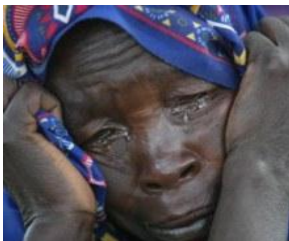
Imagem 4 - As idosas negras que ao longo da vida foram desrespeitadas por ser mulher, e por sua cor, agora também sofrem por serem idosas.

De modo geral, a imagem da velhice é mais negativa do que positiva, assim vale lembrar que as medidas (como no caso do Estatuto do idoso) muitas vezes são enganosas o que costuma ser particularmente verdadeiro em um país como o Brasil, tão marcado por desigualdade de classe social e de gênero. Pesquisas ou indicadores levam-nos a pensar que a situação está melhorando para os idosos brasileiros. por outro lado podem esconder graves problemas vividos por grande parte desta população, como exemplo idosos do nordeste, onde o acesso a instituições publicas são mais restritos, levando a uma total indiferença por parte da sociedade.