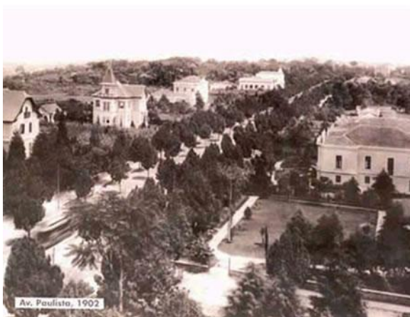
Av. Paulista, 1902

No que se refere ao fato de vivermos hoje em uma cidade tão desenvolvida, nos faz lembrar que toda esta importância se deve ao fato de que um dia, alguém deve ter trabalhado para que isto tudo fosse erguido.