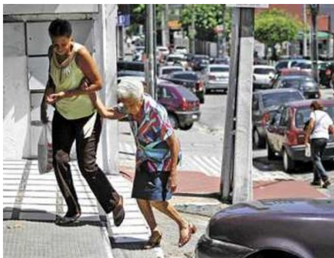
Imagem 7 - Outro problema que a cada dia vem aumentando, são as quantidades de automóveis nas ruas, onde andar a pé mesmo para os que dispõem de saúde e agilidade vem ficando cada vez mais perigoso.

Todas estas mudanças (teóricas) contribuem para que as pessoas idosas “fiquem presas” dentro de suas residências. (por vontade própria ou imposição da família) desta forma fazendo com que a velhice, seja a cada dia menos desejada e admirada.