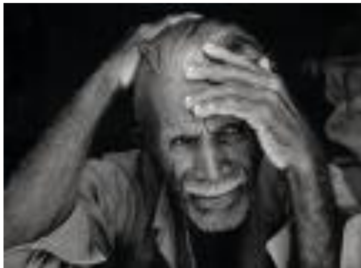
Imagem 3 - A falta de preocupação é tamanha, que tais doenças são comumente relacionadas a doenças de velho!

Algumas doenças vêm acompanhando o homem há algumas décadas, como algumas epidemias (febre amarela, rubéola, poliomielite...), a cada uma destas doenças que afetaram grande parte da população, fez com que a medicina acelerasse seu processo de pesquisa para combatê-los. Algumas outras doenças, quando se tem como público alvo as pessoas mais idosas, (mesmo quando temos algumas pesquisas) pouco despertam o interesse da sociedade geral como, por exemplo, o mau de Parkinson.