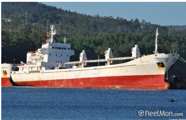
Figura 4: Navio Frigorífico