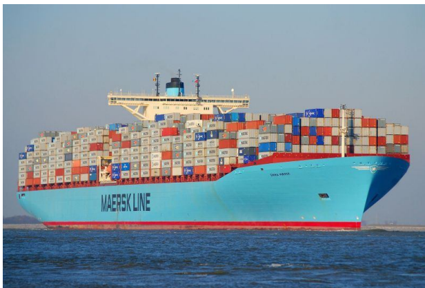
Figura 2: Navio Porta Contêiner