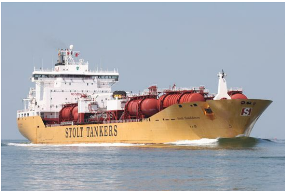
Figura 6: Navio Tanque