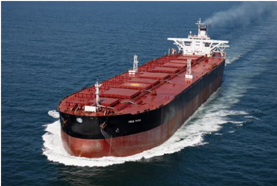
Figura 5: Navios Graneleiros