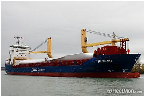
Figura 1: Navio de Carga Geral