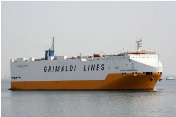
Figura 3: Navio Roll-On-Roll-Off