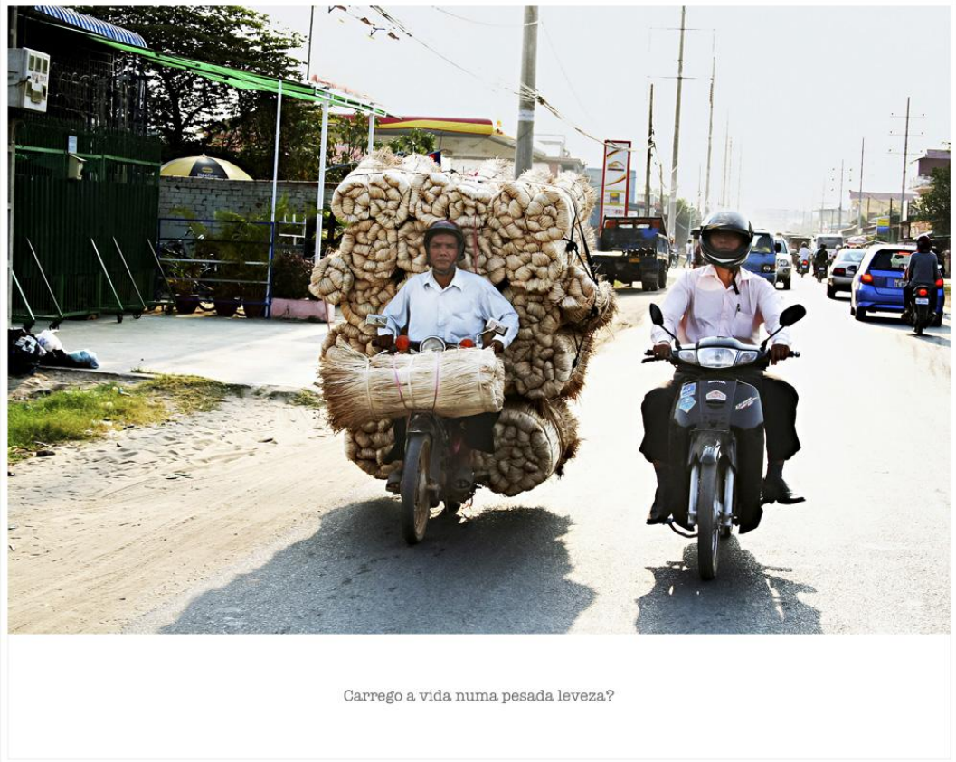
foto 5 - “Lendo a pergunta, essa foto me fez pensar que é a pergunta que te volta para dentro, você pensa na sua vida. Às vezes você olha, você vê a sua vida cheia de problemas e tal, aí você acha que você é daquele lado esquerdo. Mas se você for ver, o que ele tem é uma palha, que não é tão pesado assim...”

Aqui é possível identificar alguns conceitos da Psicanálise, anteriormente explicados nesta monografia: ao se colocar no lugar do personagem da fotografia, o espectador criou uma relação de espelhamento; trata-se, portanto, de uma ‘identificação imaginária’ com seu semelhante que acaba por voltar para o próprio sujeito.