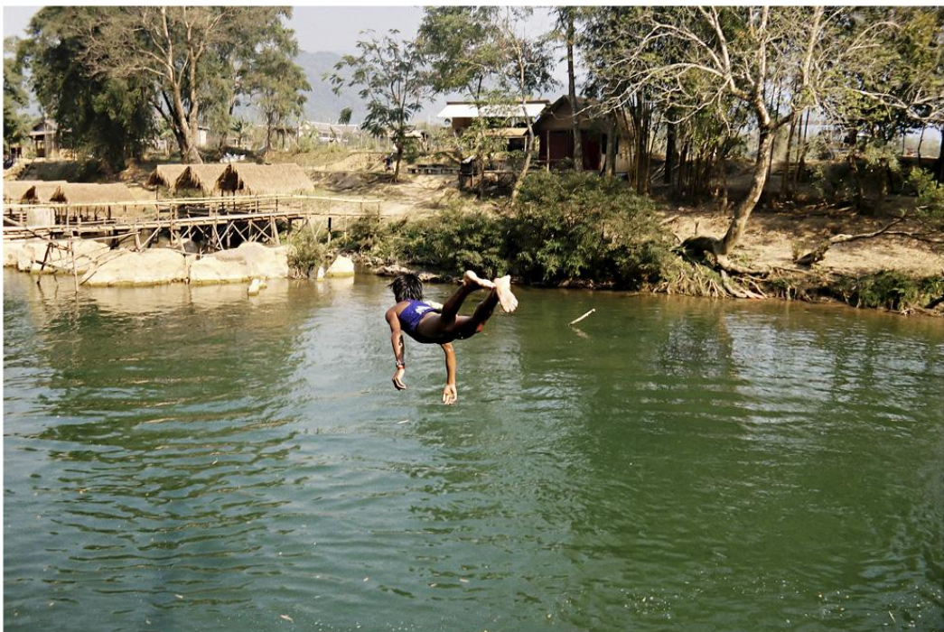
Menino é peixe-voador?