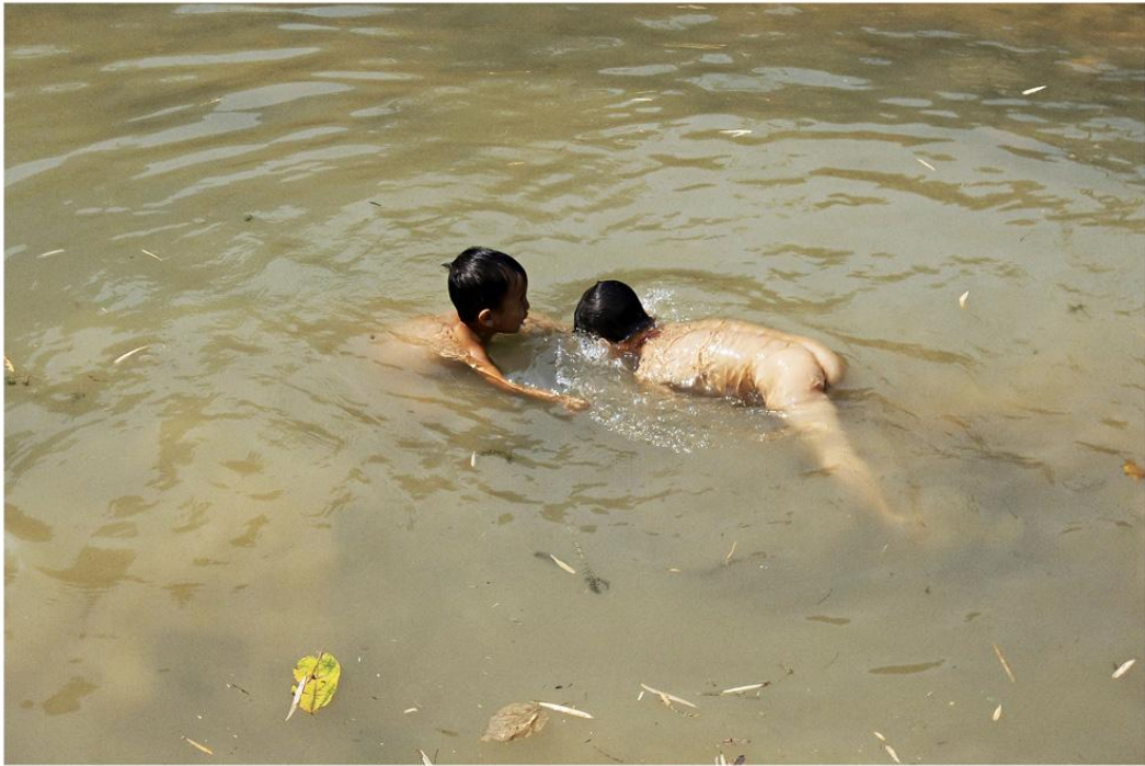
Banho de rio adoça a infância?