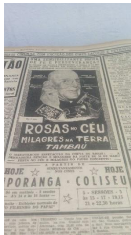
(A Tribuna, 09/06/1955)

Até a presente data desconhece-se quando a devoção ao “Marinheiro Wandenkolk” iniciou-se, porém o culto a esse “santinho” passa de geração a geração. Umbandistas, kardecistas, católicos, entre outros adeptos de outras religiões, encontram-se no Paquetá para agradecimentos e pedidos. Em 02 de novembro de 2017, observamos que, no mausoléu, foram colocadas balas e velas brancas. A motivação para essa atitude foi, segundo as narrativas populares, por ser considerado um “santo menino”, protetor das crianças. Assim como na tradição das religiões de matriz africana, Wandenkolk é tratado como um “erê”,