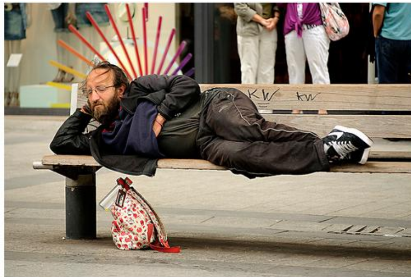
Figura 4: Morador de rua bem vestido em Paris

Em relação aos “direitos” dos moradores de rua em Paris, a maioria das análises indicam que eles não são como os de São Paulo (sem higiene, com roupas rasgadas e famintos). “É mais fácil ser um morador de rua em Paris do que em qualquer outra cidade da União Europeia”, afirmou Julien Damon, um sociólogo da universidade Sciences Po, à revista britânica The Economist (2012).