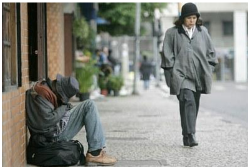
Figura 1: O morador de rua e a indiferença

Pela falta de cuidados higiênicos e por suas roupagens, dificilmente os moradores de rua ganham a atenção dos transeuntes, que os tratam muitas vezes como seres invisíveis. Quando são raramente notados, eles também sofrem abusos.