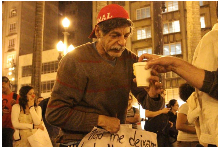
Figura 2: Sopão no Centro de SP