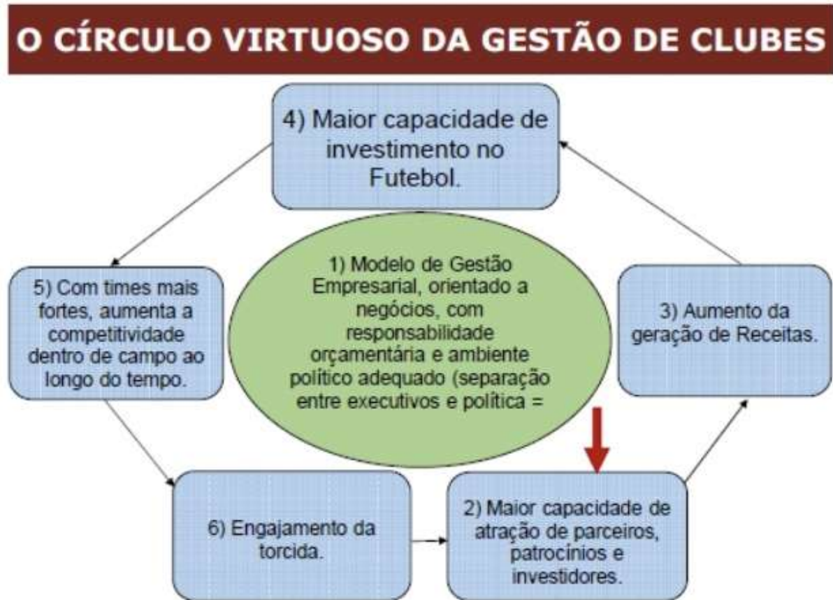
FIGURA 4 – Modelo de Gestão Empresarial de Clubes