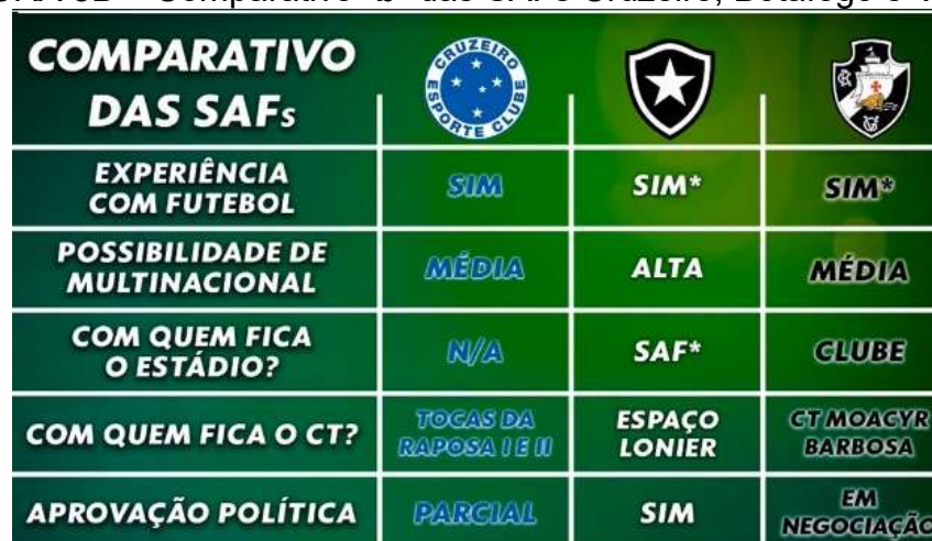
FIGURA 5B – Comparativo “b” das SAFs Cruzeiro, Botafogo e Vasco

Fonte: Capelo, no website Netvasco, 26/03/2022