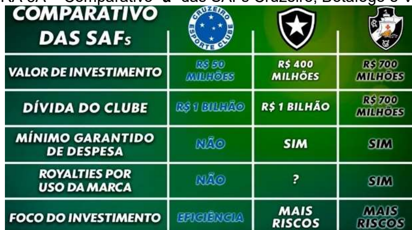
FIGURA 5A – Comparativo “a” das SAFs Cruzeiro, Botafogo e Vasco.