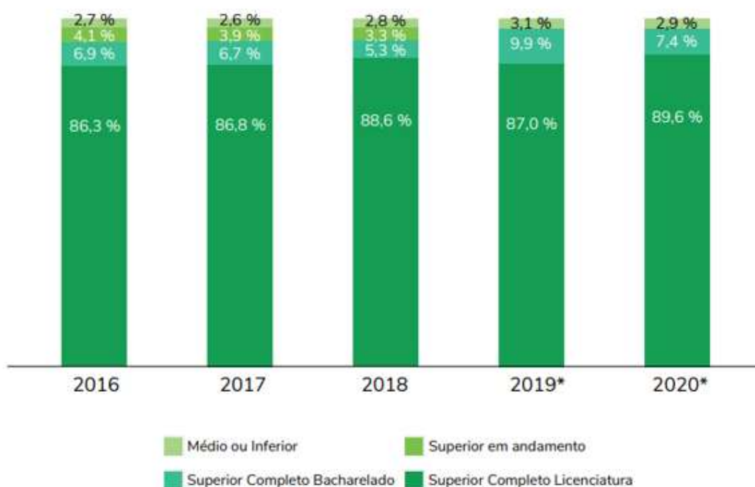
Gráfico 2 - Escolaridade dos docentes do Ensino Médio - Brasil – 2016 – 2020