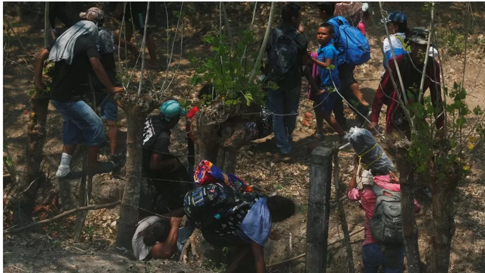
Imagem 1 – Migrantes tentando fugir após uma incursão policial