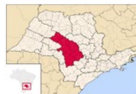
Imagem 2 – Informações da Mesorregião WIKI

O Estado de São Paulo, após a invasão portuguesa foi rota para a interiorização do país, sobretudo com a intervenção das “Bandeiras” (expedições que conduziram o processo de interiorização e destruição de várias etnias indígenas). Mas a partir do século XIX começa a ter destaque no cenário nacional quando se torna referência na produção de café que de tão importante para a economia paulista foi chamado de “ouro verde” por muito tempo, como apresenta o IBGE (2023) quando destaca a história do Estado: