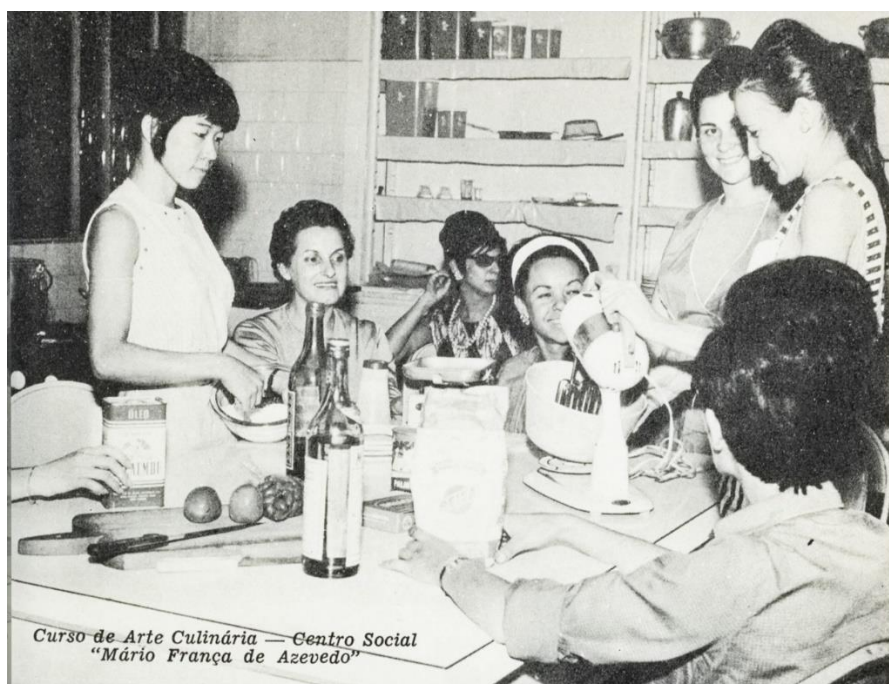
Figura 7 – Aula do curso de Arte Culinária no Centro Social “Mário França de Azevedo”. Sesc, 1962