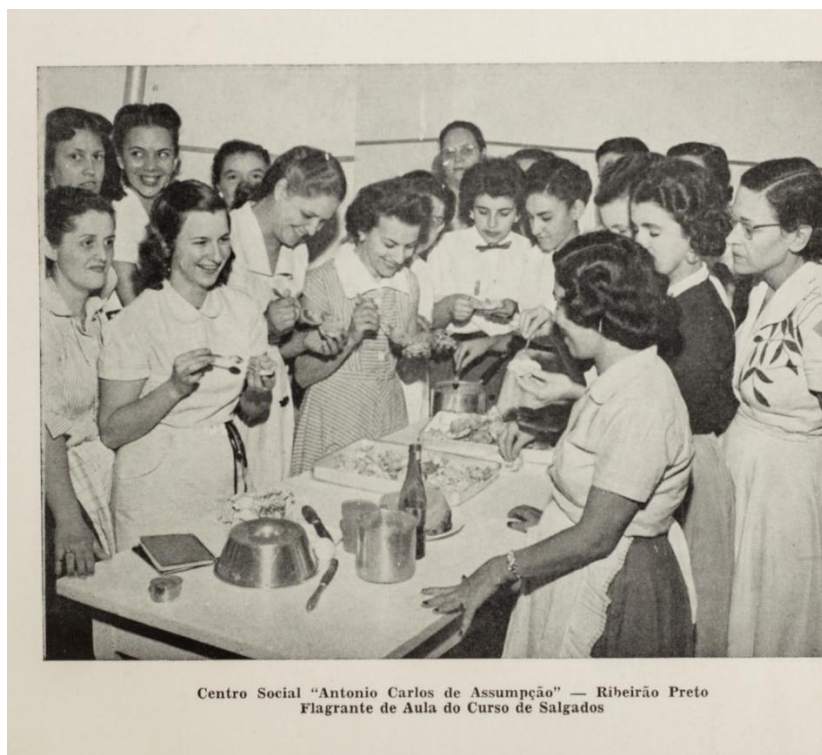
Figura 8 – Aula do curso de Salgados no Centro Social “Antônio Carlos de Assumpção”. Sesc, 1954