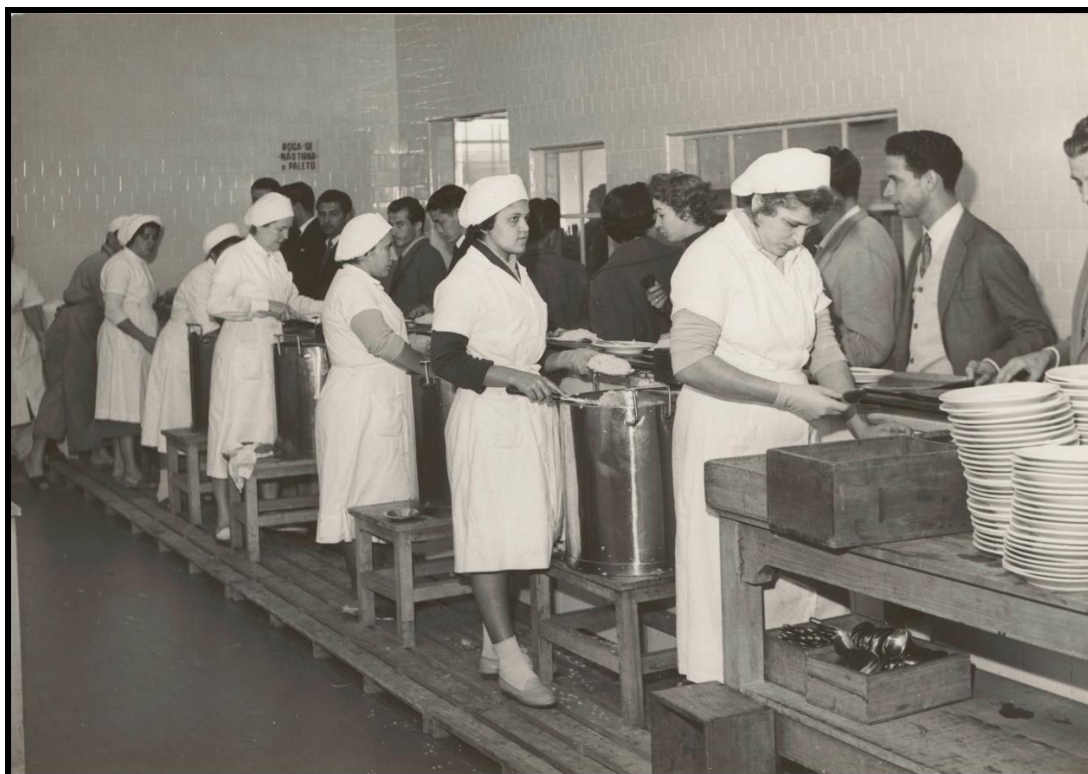
Figura 2 – Restaurante do Comercário “Alcântara Machado”. Sesc, 1960