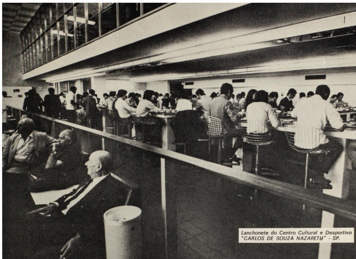
Lanchonete do Centro Cultural e Desportivo "CARLOS DE SOUZA NAZARETH" - SP.

mesas compartilhadas, em um sistema que privilegia a rotatividade em detrimento à comensalidade, ainda que ela ocorra, mas não há mais uma ideia de mesa individual. Busca-se a relação social no entorno do ambiente alimentar e a integralidade dos espaços.