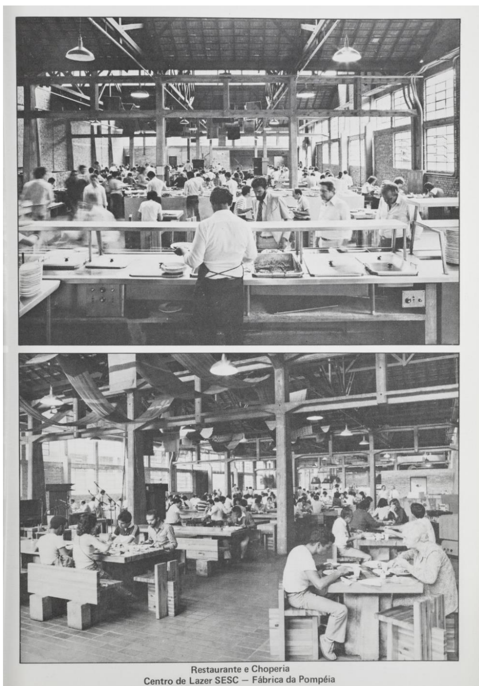
Figura 9 – Restaurante e Choperia do Centro de Lazer SESC – Fábrica da Pompéia. Sesc, 1984

Em 1989, o novo programa de trabalho e o Plano Nacional de Ação do Sesc (Planesc), entre 1988 e 1990, vão prever diversas reformas de equipamentos e inauguração de novas unidades operacionais. Além do planejamento de novas programações e modificação em alguns projetos e atividades.