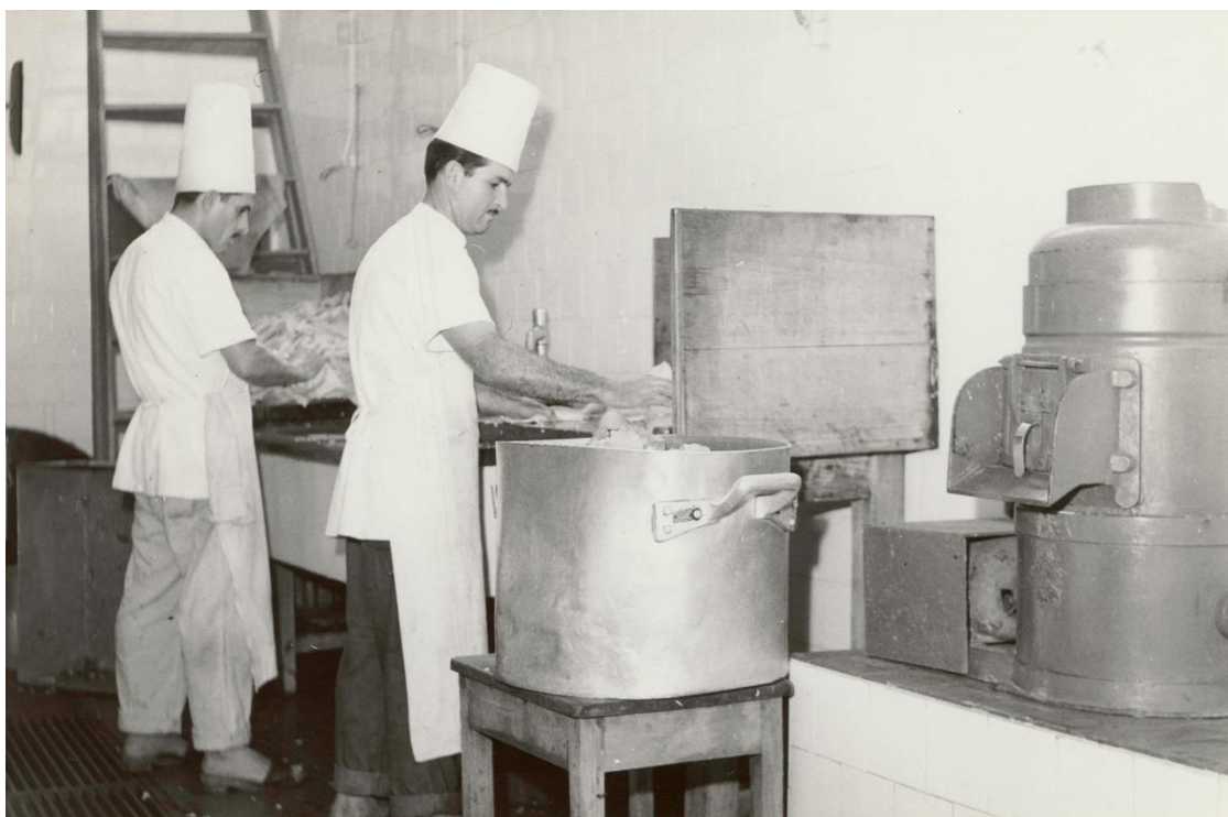
Figura 3 – Restaurante do Comercário “Alcântara Machado”. Sesc, 1960