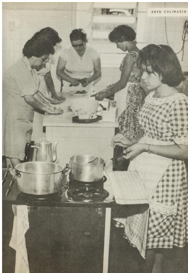
Figura 6 – Aula do curso de Arte Culinária. Sesc, 1962