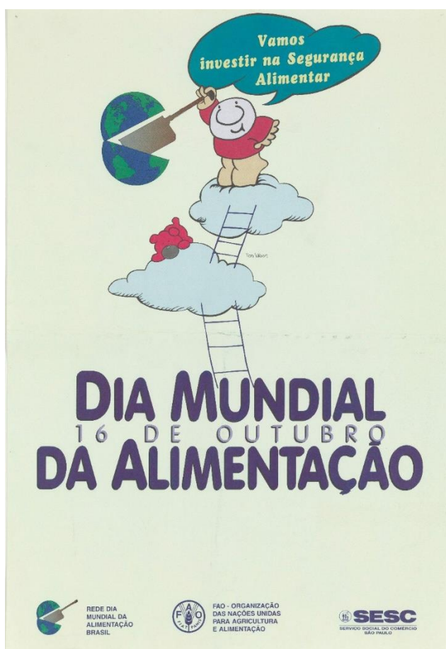
Figura 10 – Dia Mundial da Alimentação. Cartazete. Sesc, Sem Data.