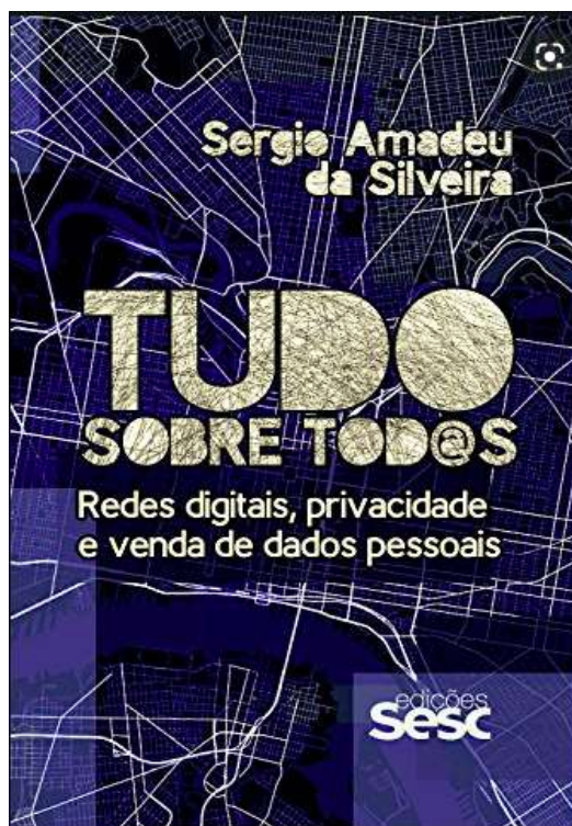
Figura 5 – Capa do Livro “Tudo sobre todos”