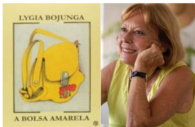
Figura 6 – Capa e autora do Livro “Bolsa Amarela”