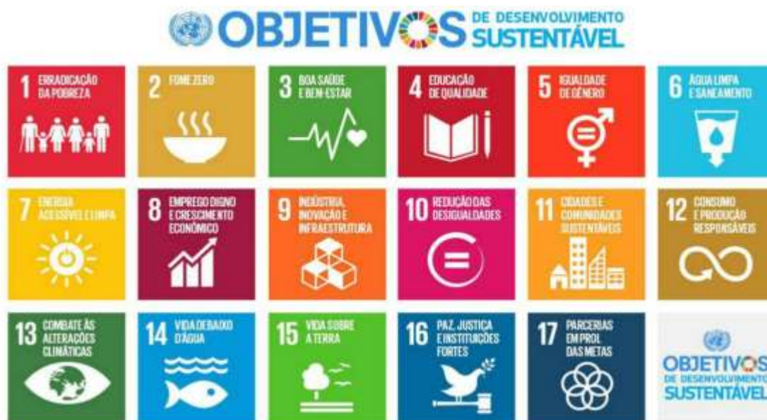
Figura 1 – Objetivos de Desenvolvimento Sustentável