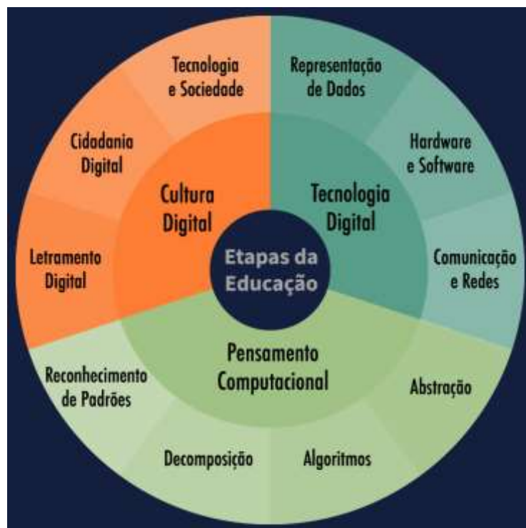
Figura 3 – Currículo de Tecnologia