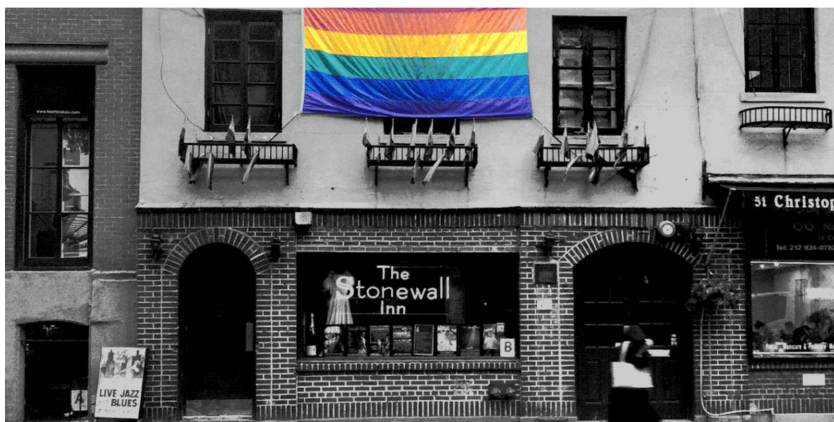
Figura 3: The Stonewall inn 6

forma também truculenta. A revolta se espalhou pela cidade, os combates entre polícia e população LGBTI aumentaram, durando em torno de três dias. No ano seguinte, a população se organizou – precisamente em um de julho - e realizou uma grande passeata, dando origem à primeira parada do orgulho LGBTI 5 . A partir de então, o dia 28 de junho fica conhecido como dia internacional do combate à LGBTIfobia (SILVA & SOUZA, 2017).