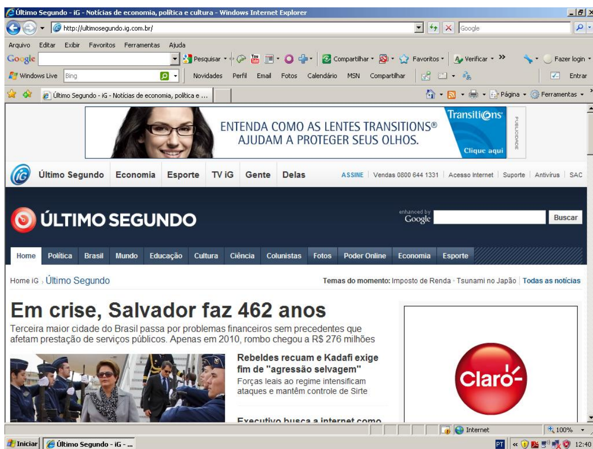
Figura 2: hiperlink “Último Segundo” e seus diversos canais na horizontal.

Obviamente o cenário de mil notícias por dia deixa claro que a seleção se dá na base da atualização contínua, entretanto em outros casos a notícia permanece a mesma o dia inteiro, principalmente quando já está editada no formato hipermídia. Portanto, essa pesquisa utilizou como método salvar os links noticiados no formato hipermídia a fim de analisar imagens nos capítulos posteriores.