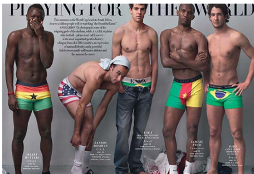
Imagem 6: Kaká e astros do futebol mundial posam de cuecas.

O corpo esbelto e musculado sobrepõe-se ao corpo saudável e a finalidade estética consolida-se como modelo a emular. Por intermédio de um trabalho sobre o corpo, o indivíduo pode reestruturar ou reconstruir sua identidade e inclusive restabelecer sua autorrepresentação.