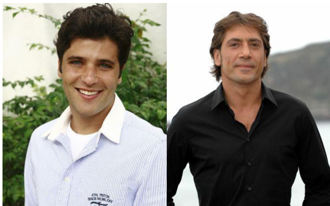
Imagem 10: Homens delicados vs. viris.

como estão submetidos ao gênero masculino essas novas abordagens e coerções estéticas. O corpo é um importante gerador e difusor de mensagens. Seja qual for a sua forma de apresentação: desnudo, musculado, na moda, modificado ou customizado, o corpo discursa, e, portanto é mensagem sígnica.