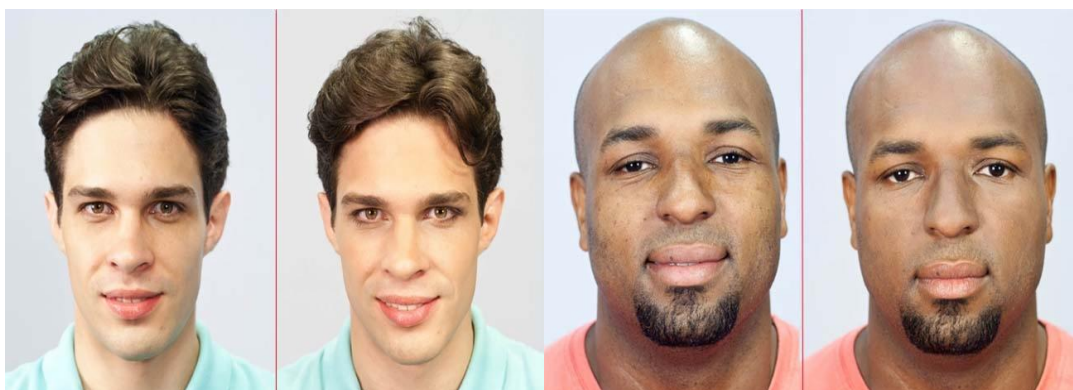
Imagem (3) e (4): maquiagem para homens: nós testamos.

Além de melhorar visualmente a aparência de ambos, também refletem uma aparência menos cansada e exausta por uma visualização nova carregada de felicidade, leve, prontos para as novas ocasiões sociais que surjam, ou seja, é plenamente visível a satisfação dos resultados alcançados quando comparados com a ideia do antes, onde a representação facial é pesada, parecendo carregar uma aparência com poucas expectativas sociais.