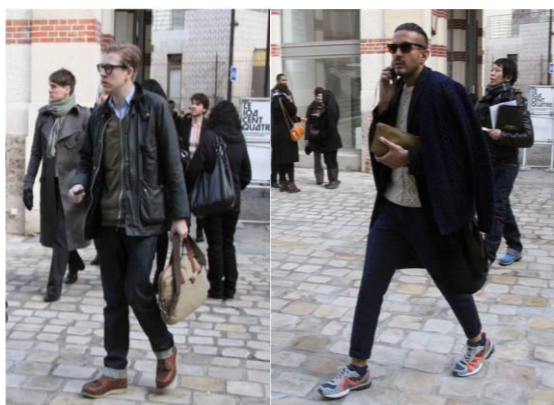
IMAGEM 9: Homens de bolsa, bolsinha e bolsão

indústria midiática descobriu no corpo masculino uma grande potencialidade de consumo e tornou-a um forte mercado a ser explorado pela cultura do consumo. O corpo masculino passa a desenhar um novo papel no cenário e debate midiático. A publicidade voltou-se para uma produção de sentido diferente no que se trata do corpo masculino.