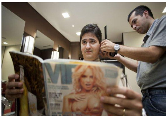
Imagem8: Salões de beleza oferecem serviços exclusivos para homens

A representação aqui sugere os efeitos a serem reproduzidos em seus receptores, isto é, nos tipos de interpretação que o ator tem como potencial de despertar em seus visualizadores mais diretos. Desse modo, a teoria semiótica nos permite penetrar no próprio movimento interno das mensagens, no modo como elas são engendradas, nos procedimentos e recursos nela utilizados. Segundo (SANTAELLA, 2002) permite - nos também captar os vetores de referencialidade não apenas no contexto mais imediato, como também a um contexto estendido, pois em todo o processo de signos ficam marcas deixadas pela história, pelo nível de desenvolvimento das forças produtivas econômicas, pela técnica e pelo sujeito que a produz.