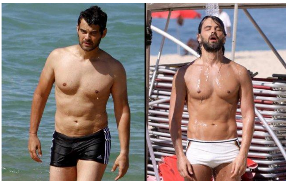
Imagem 7: "Fiquei mais vaidoso para o personagem", diz Carmo Dalla Vecchia FONTE: http://gente.ig.com.br/fiquei+mais+vaidoso+para+o+personagem+diz+carmo+dalla+vecchia/n1300098868525.html . Acesso em 25/04/2011.

Dessa forma, o observador direto pode ser influenciado a mudar o seu comportamento, estilo e pensamento. A reação no percepto lhe causa na mente a produção de possíveis relações sob a lei da similaridade. As influências da comunicação midiática carregada de pressupostos semióticos reafirmam a tendência da cultura do narciso, a verdadeira busca por um padrão físico e estético tem na imagem um forte argumento convincente e transformador.