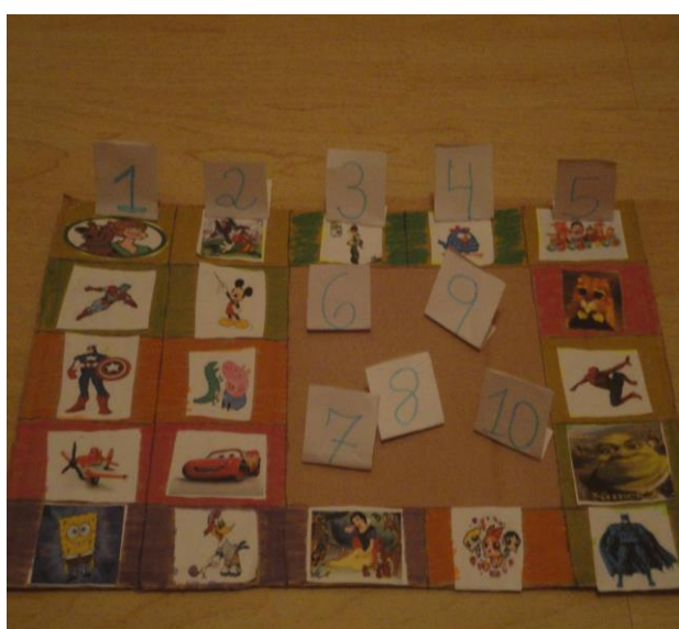
Figura 5: “Sequência Numérica”

Nesta mesma atividade foi pedido para a criança ordenar as figuras utilizando as fichas com os números.