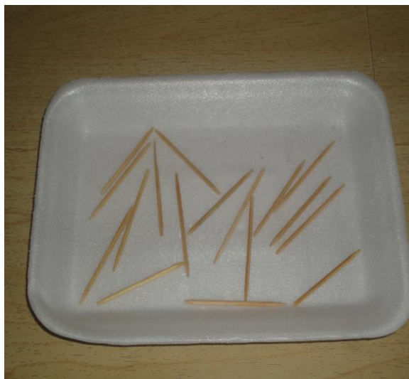
Figura 1: “Material Reciclável: bandeja de isopor e palitos de dentes”

Com esta criança da sala 1 foi usado materiais recicláveis para serem confeccionados materiais de encaixe. Como a Professora Titular estava desenvolvendo um trabalho com as crianças sobre as formas geométricas, a docente de apoio pedagógico pesquisou alguma atividade em que a participação da criança com necessidade educacional pudesse ser efetiva.