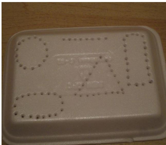
Figura 2: “Formas Geométricas”

Nesta figura à cima a professora de apoio furou o isopor com o próprio palito de dente e fez as formas das figuras geométricas. Com este suporte a criança teria que fazer o contorno das formas encaixando os palitos oferecidos.