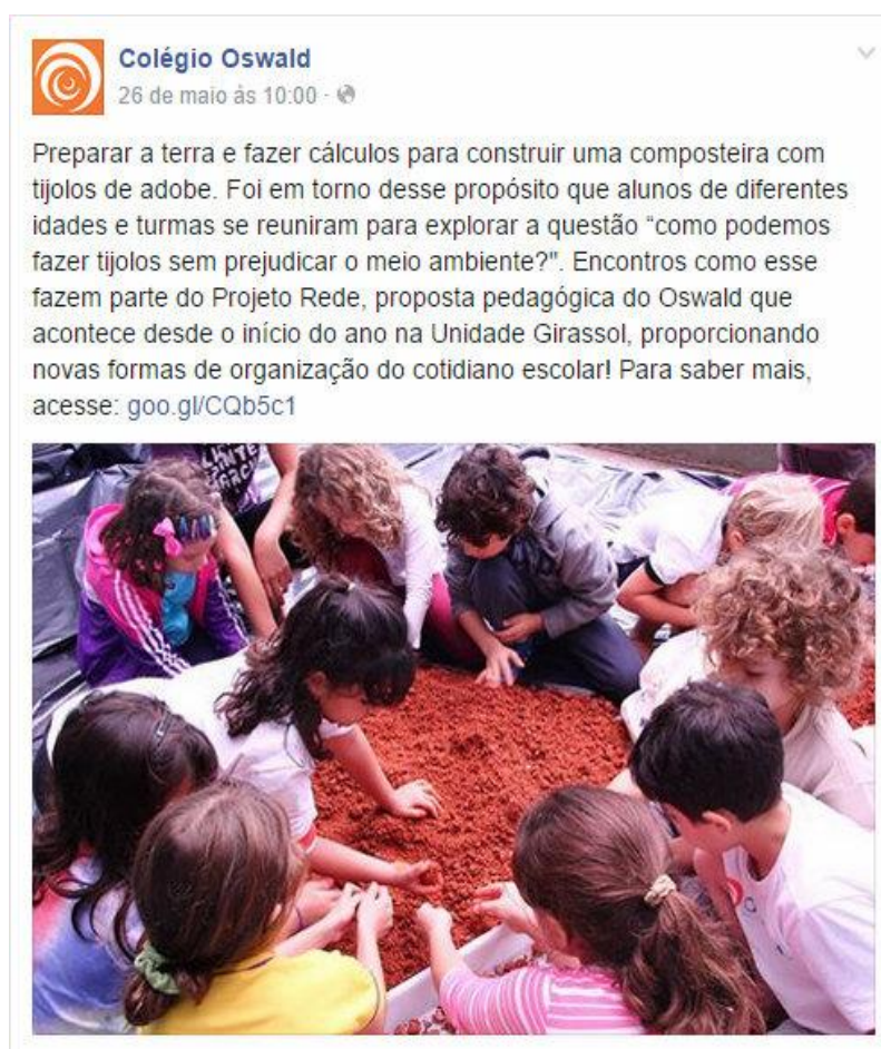
Figura 7: Exemplo de postagem divulgando atividade do Projeto “Rede”, no Ensino Fundamental 1.

Uma das postagens que compõe esta categoria se refere à um projeto chamado “Rede”. Tal projeto envolve alunos do Grupo 5 da Educação Infantil (faixa etária de quatro e cinco anos) e dos 5 primeiros anos do Ensino Fundamental em encontros semanais em agrupamentos interidades, compostos a partir de temas de interesse dos alunos. Nesta proposta, temas como sustentabilidade, futebol, astronomia, games digitais (entre outros) foram contemplados. Tais agrupamentos tem números de participantes diferentes, visto que os alunos se inscrevem naqueles que tem maior interesse. A postagem referente à este projeto se destaca em relação ao número de opções “curtir” (428).