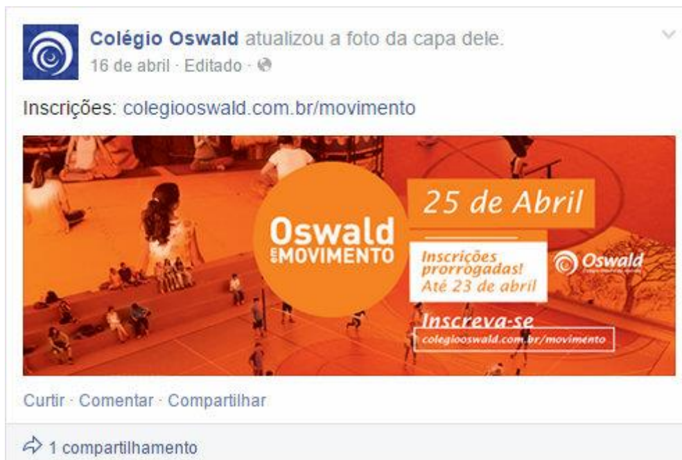
Figura 8: Exemplo de postagem de atualização de foto de capa.

A postagem acima se trata de uma atualização da foto de um evento em função da mudança da data limite de inscrição para a atividade. O mesmo evento já era tema da foto de capa anterior e a este fato podemos atribuir o nível baixo de interações com esta publicação.