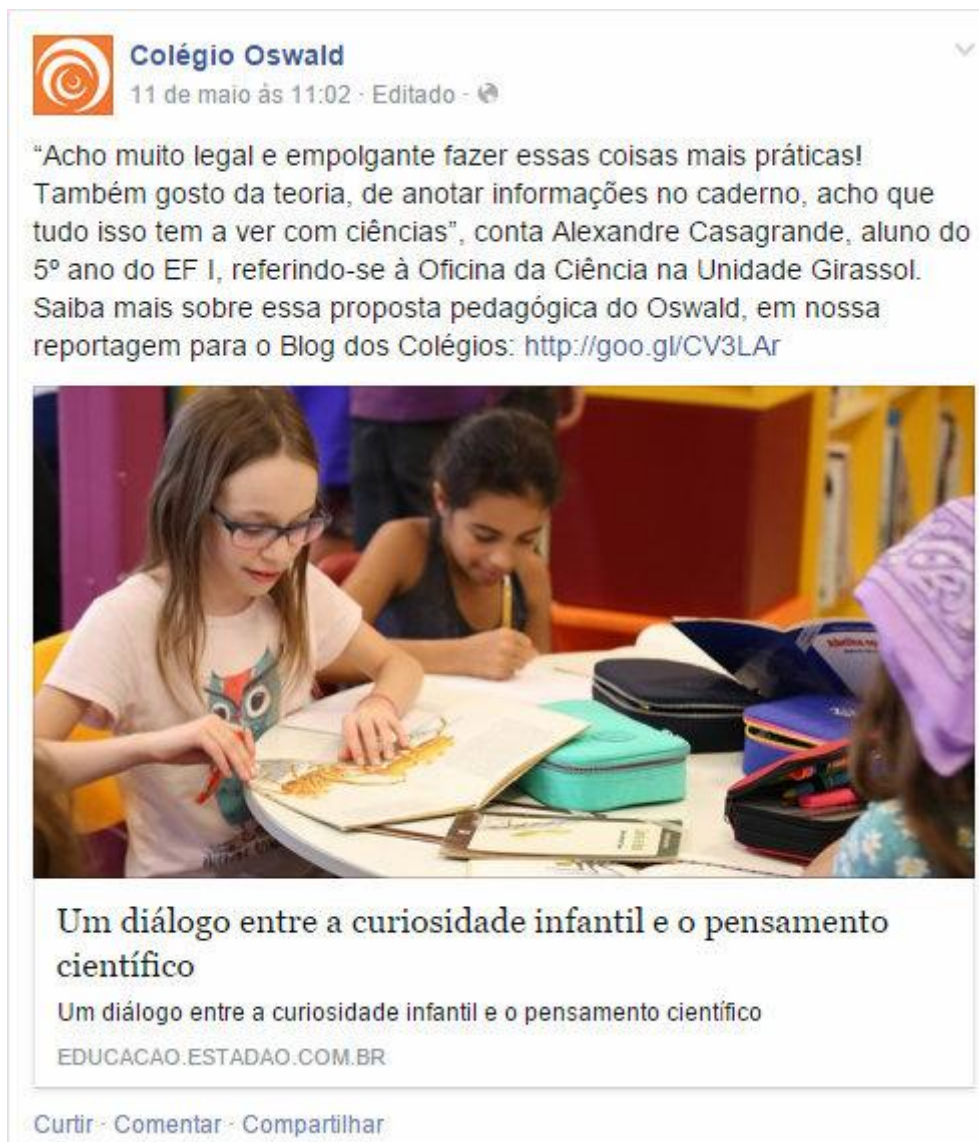
Figura 2: Exemplo de postagem de link de matéria da página do jornal O Estado de São Paulo.

Lévy (2010), trata-se de uma interação entre as funções massivas e pós-massivas de comunicação, corroborando a hipótese dos autores de que tais dimensões não são antagônicas, mas complementares. As postagens em questão foram, em sua totalidade, constituídas por replicações de links que levam à sites de jornais, como mostra a figura abaixo 1 .