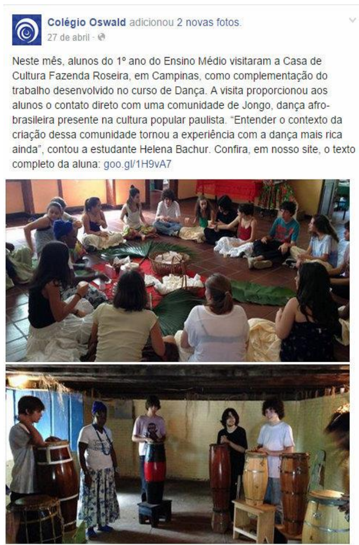
Figura 6: Exemplo de postagem divulgando trabalho de campo de alunos do Ensino Médio.

Três postagens são relacionadas à um projeto interdisciplinar chamado “Semana Literária”. Trata-se de um projeto anual, com duração de uma semana, que envolve todos os níveis escolares. Para promover um aprofundamento no universo literário de um autor selecionado previamente pela direção da escola em parceria com a equipe de educadores da área de literatura, os alunos se pesquisam diversos aspectos relacionados à vida e obra do mesmo, articulando saberes de diversas áreas, como História, Geografia, Matemática, Língua Portuguesa, Literatura, Teatro, entre outras.