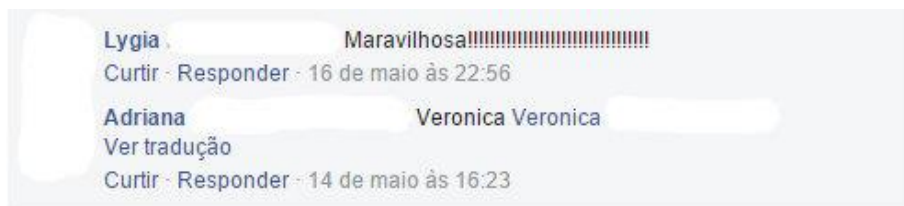
Figura 9: Exemplo de comentários em postagem.

Duas postagens obtiveram valores altos de comentários. Ambas envolvem a publicação de conteúdo produzido por alunos, mas os comentários dedicados a elas são em formatos próximos aos do exemplo acima, mantendo uma dinâmica de interação entre o usuário e a página (em oposição à interação usuário-usuário). Nesta categoria, são mais frequentes os comentários que carregam perguntas a serem respondidas pela instituição, porém todos em caráter informativo, em que as dúvidas se referem a dados operacionais do evento.