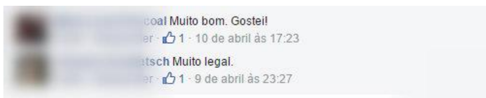
Figura 3: Exemplo de comentários expressando aprovação do conteúdo postado.

Já em relação aos comentários, temos uma frequência pequena: entre dois e seis comentários em uma mesma postagem. A moda e a média apresentam o mesmo valor, o que nos mostra uma distribuição equilibrada dessa frequência. Nessa categoria, comparativamente às outras, temos um número pequeno de comentários. Podemos dizer que se trata de uma classe de postagens que não promove muita interação verbal entre os seguidores. Ao analisar o conteúdo dos comentários, é possível perceber um padrão - a maioria deles é uma expressão verbal de aprovação da postagem, como mostra a figura a seguir: