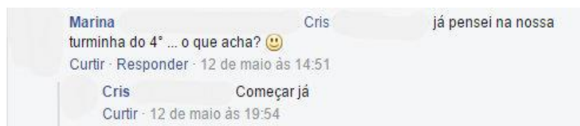
Figura 4: exemplo de comentário com marcação de seguidores da página.

Os comentários desta classe de postagens envolvem, como descrito na categoria anterior, frases de aprovação por parte dos seguidores. Além desta forma, é possível encontrar, com bastante frequência, comentários que contêm a marcação de um amigo. No site de redes sociais Facebook, é possível fazer marcações de pessoas que constam na rede do usuário, para que esta pessoa seja notificada sobre a publicação. É uma maneira de “chamar a atenção” de amigos que possam se interessar por aquele assunto, a fim de divulgar tal informação. Em tais comentários, podemos ver marcações de familiares dos alunos, como também de seguidores que são educadores de outras instituições e acompanham o trabalho do Colégio Oswald de Andrade como referência, como mostra a figura a seguir: