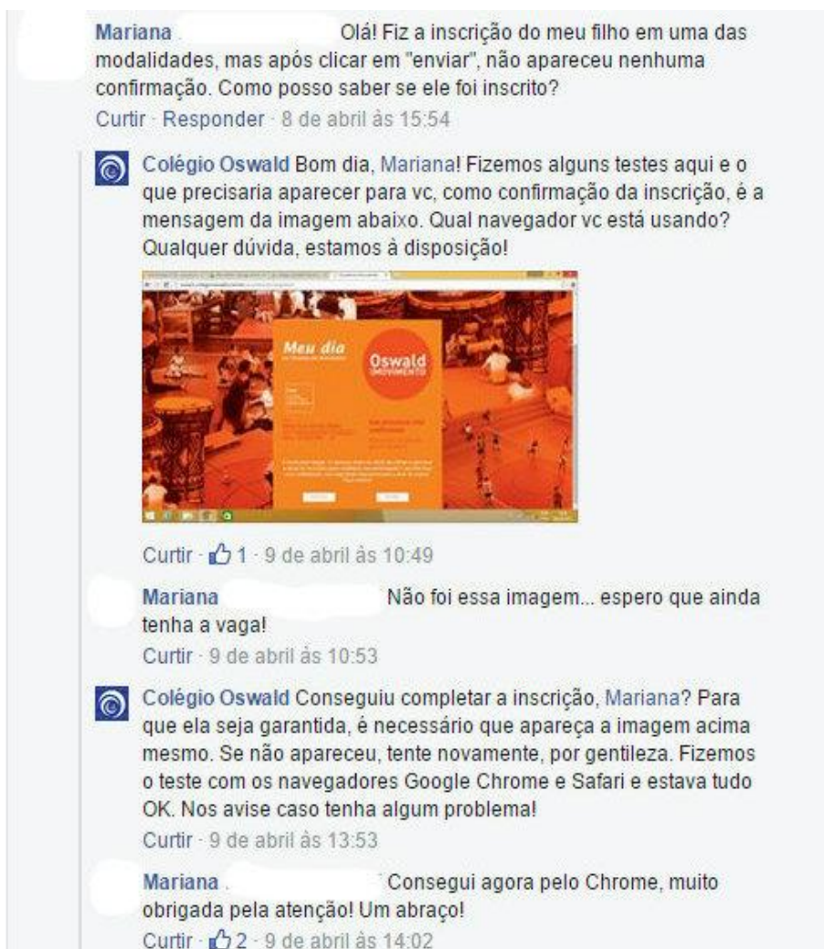
Figura 10: Exemplo de comentários com interação entre usuário e a página.

Duas postagens obtiveram valores altos de comentários. Ambas envolvem a publicação de conteúdo produzido por alunos, mas os comentários dedicados a elas são em formatos próximos aos do exemplo acima, mantendo uma dinâmica de interação entre o usuário e a página (em oposição à interação usuário-usuário). Nesta categoria, são mais frequentes os comentários que carregam perguntas a serem respondidas pela instituição, porém todos em caráter informativo, em que as dúvidas se referem a dados operacionais do evento.