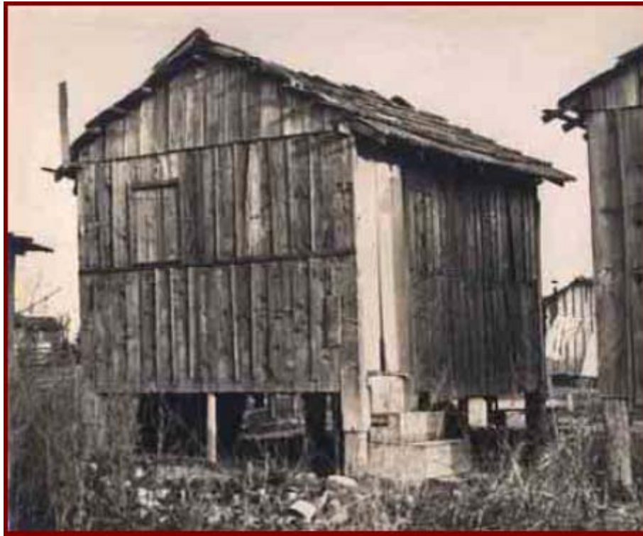
Barraco nº 9 na favela do Canindé, onde Carolina morou com seus filhos de 1948 a 1960. Jornal Última Hora, 22/ 12/ 1960. Arquivo do Estado de São Paulo. Código: ICO- UH- 0369.