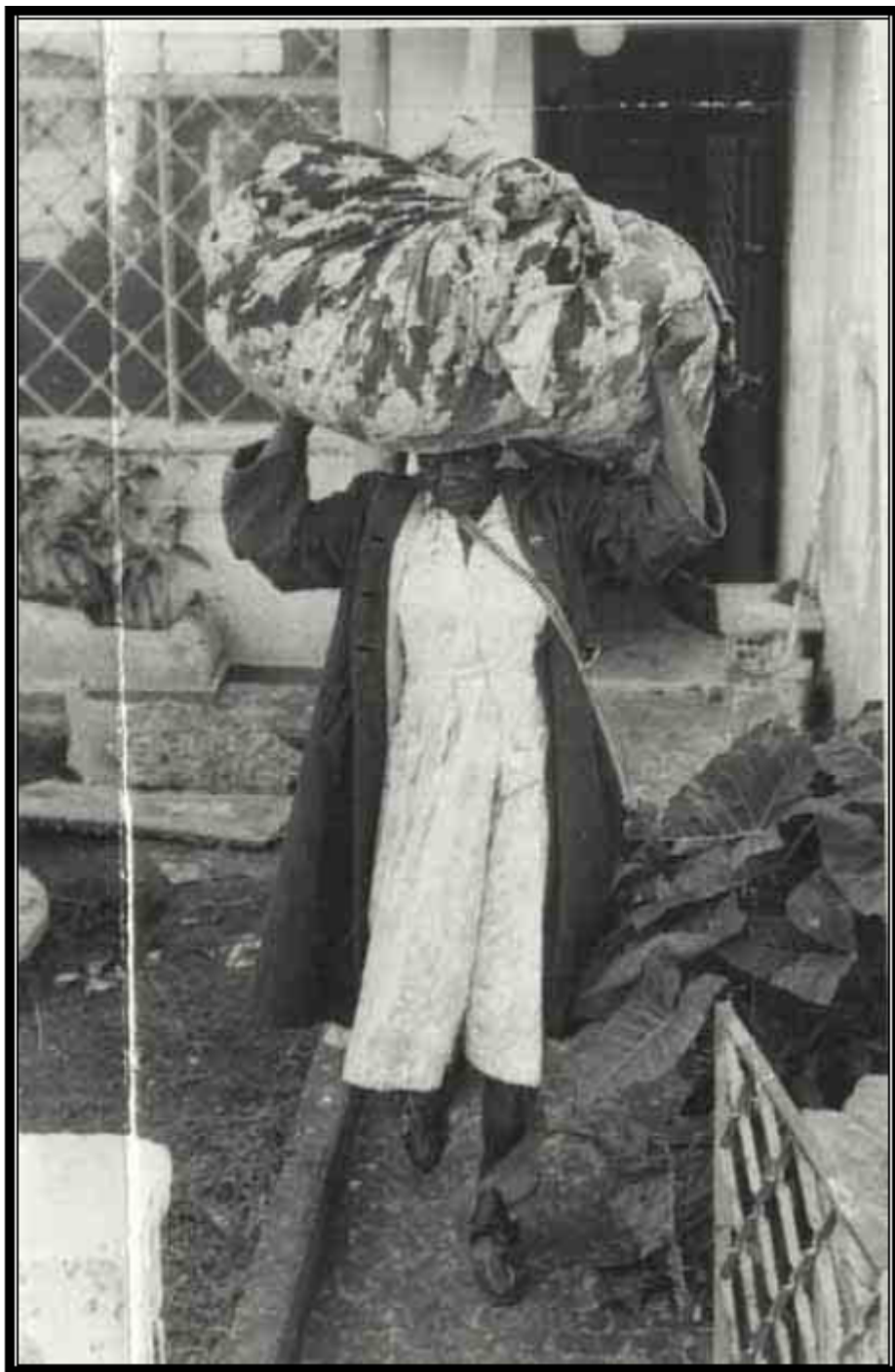
Carolina Maria de Jesus mudando-se da casa de alvenaria para o sítio, 1964. Jornal Última Hora, 28/ 01/ 1964. Arquivo do Estado de São Paulo. Código: ICO- UH- 0369.