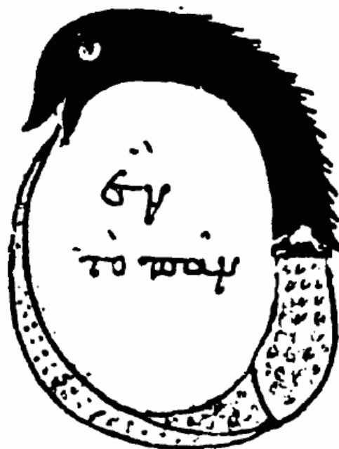
Figura 1 Uroboros- Desconhecido - Chrysopoea of Cleopatra (Codex Marcianus graecus 299 fol. 188v)

A Grande Mãe representa apenas uma parcela do que corresponde ao princípio , ao Oroboro . De maneira extremamente sintética, o Oroboro , figura de uma serpente devorando o próprio rabo, simbolicamente representa o “tudo”, como pode-se ver na figura 1 que apresenta, “εν το παν” (“O um é o todo”), o Oroboro simboliza o início e o fim, o positivo e o negativo, o masculino e o feminino. É dessa representação hermafrodita (já que contém ambos os gêneros sem a distinção