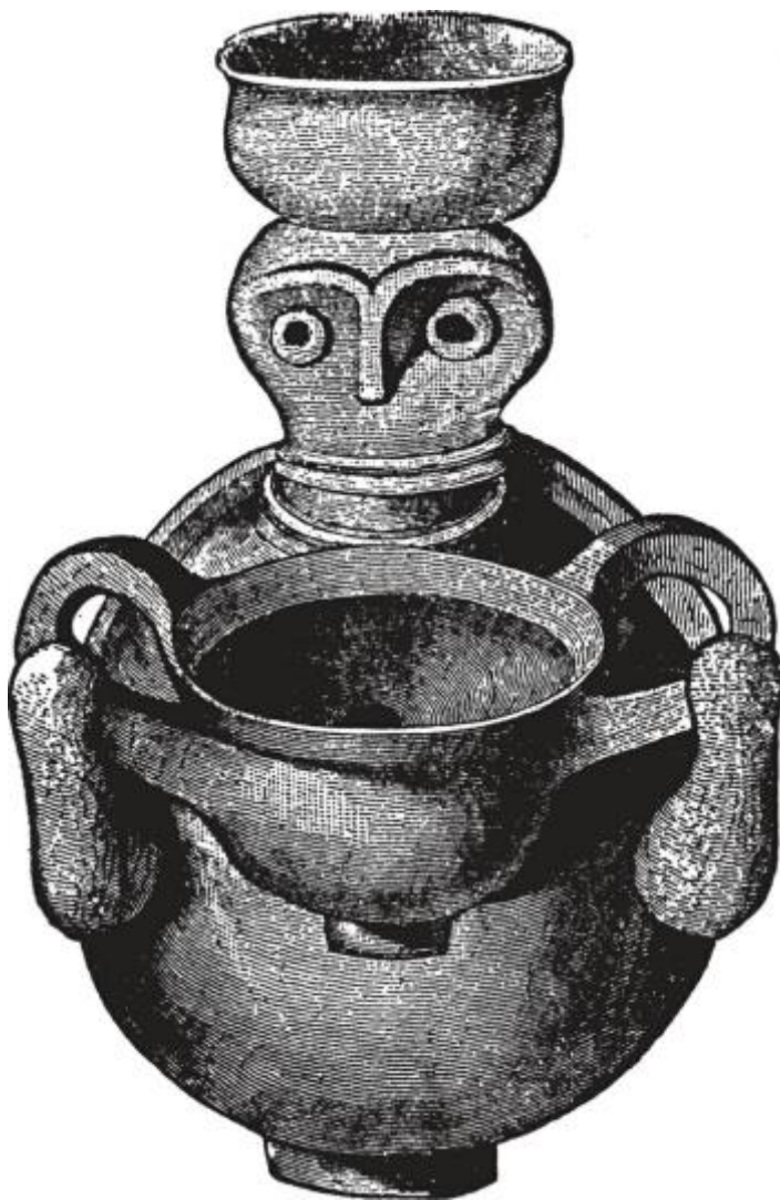
Figura 3- Urna com rosto; argila vermelha, Tróia, IV estrato - Neumann. Erich. The Great Mother: Na analysis of the archetype. 1. Ed. Princeton University Press, New Jersey, 2015. p.112

O corpo como recipiente não apenas da criança, mas um espaço que “possui” também