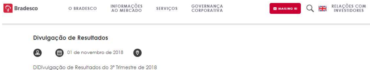
Figura 1 – Relações com Investidores

Em um exemplo apresentado na Figura 1, pode-se observar onde encontram-se informações acerca das demonstrações de resultado do Banco Bradesco em seu site.