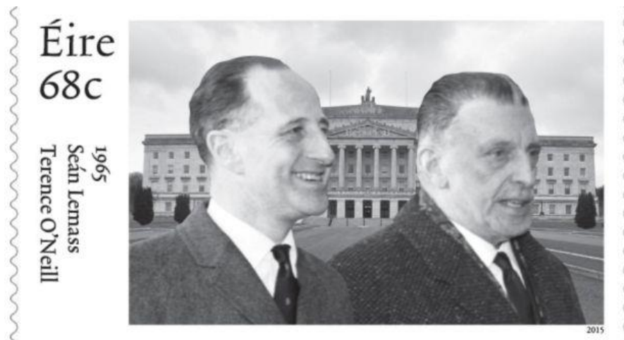
Figura 1. Selo comemorativo de 50 anos do encontro entre O'Neill (esquerda) e Lemass (direita) lançado em 2015 pelo Correio irlandês.