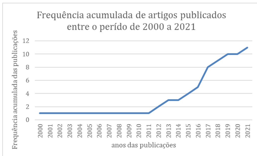
Figura 2 - frequência acumulada de artigos publicados entre 2000 e 2021.

Quanto as universidades envolvidas nas publicações temos o seguinte: Universidade Federal do Rio Grande do Sul, Universidade Federal de Santa Maria, Universidade Federal do Pará, Centro Universitário Metodista, Universidade Federal do Paraná, Pontifícia Universidade Católica do Rio de Janeiro, Universidade do Rio Grande do Norte, Universidade Federal da Bahia, Universidade de São João Del Rei, Universidade Federal de Pernambuco, Universidade Federal de Alagoas, Instituto Social Parceiros do Amanhã e Centro Universitário Christus. É interessante notar que cinco dessas universidades estão localizadas na região Nordeste do país, uma na região Norte, três na região Sudeste e quatro na região Sul e nenhuma está localizada na região Centro-Oeste.