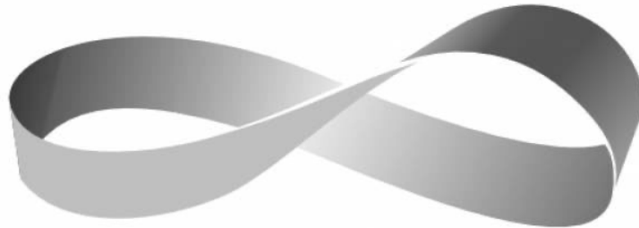
Figura 1. Representação gráfica da banda de moebius de autoria desconhecida.

e exterioridade, demonstrando assim uma contiguidade e não mais uma cisão entre sujeito versus mundo.