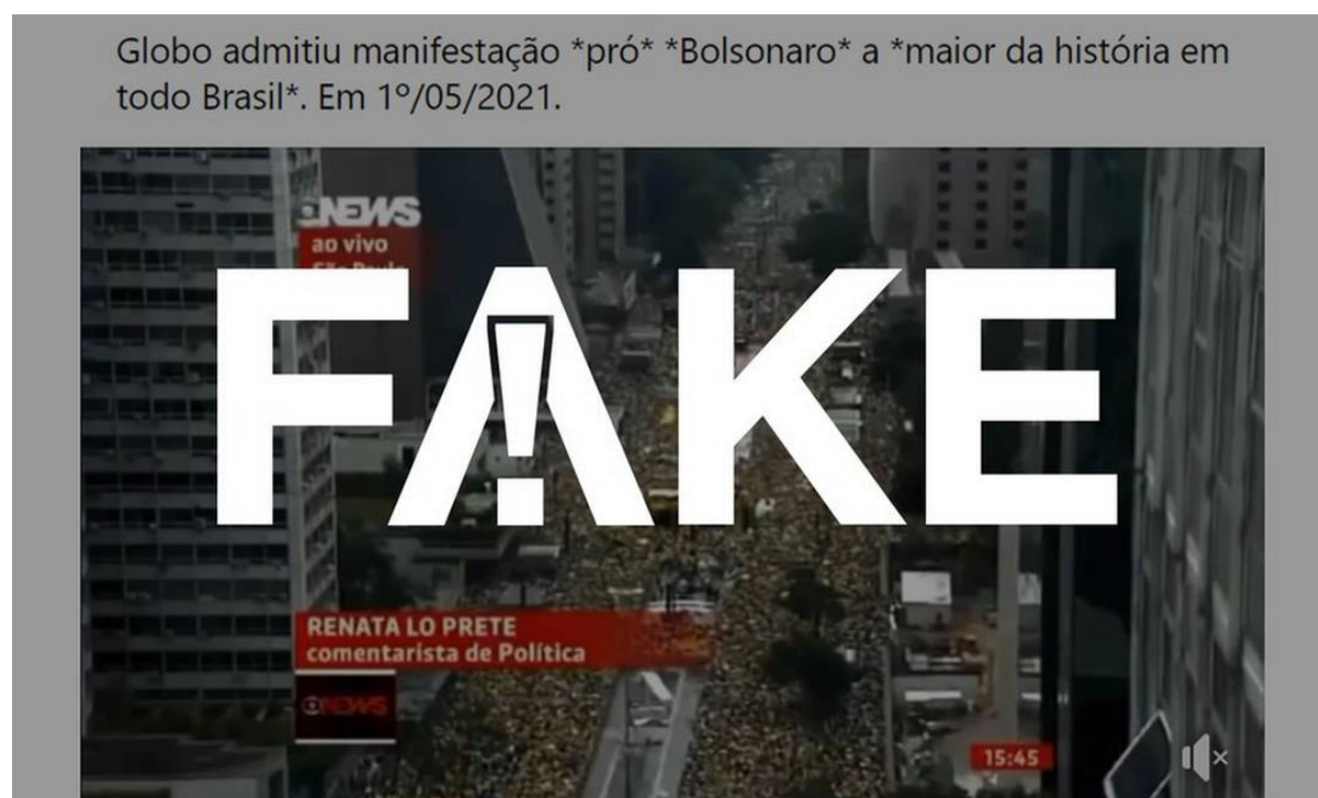
Figura 1: Fake News: Globo admitiu manifestação pró-Bolsonaro

Será? Dois dias mais tarde, o G1 publica: tratava-se de Fake News .